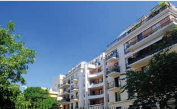
Les Jardins d'Atalante - Les Lilas Architecte : Eric Marmorat