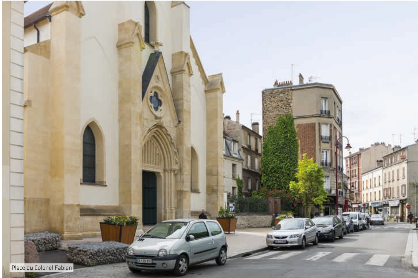
Place du Colonel Fabien