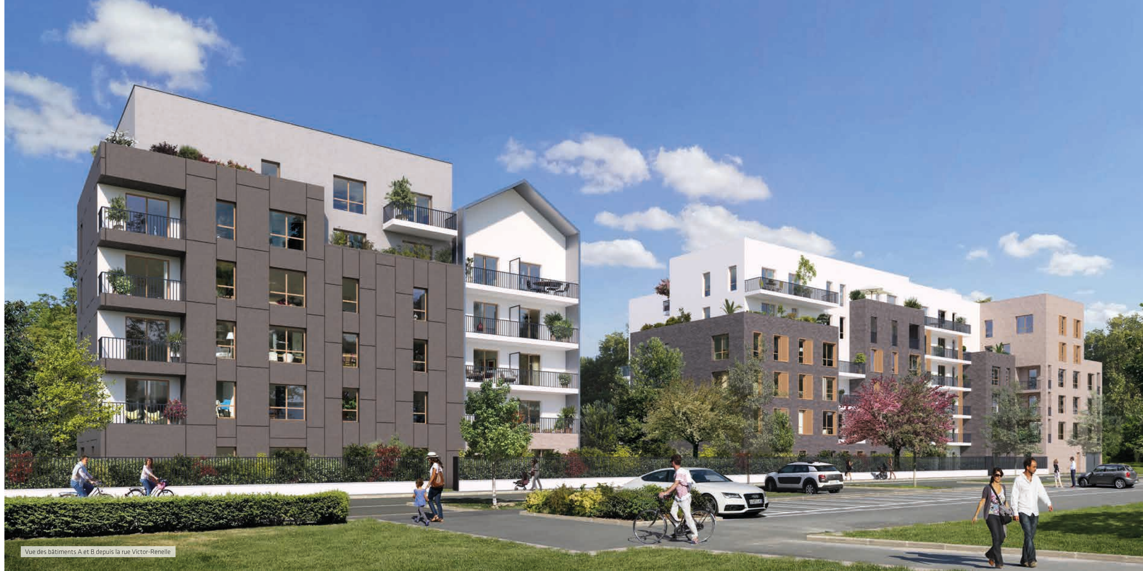
Vue des bâtiments A et B depuis la rue Victor-Renelle

La volumétrie, l'implantation et l'expression architecturale prennent en compte le tissu urbain avoisinant en réalisant des ruptures d'échelle dans le bâti rythmant la façade urbaine. Celles-ci adoptent la forme de hauteurs variées, de failles, d'un volume coiffé d'une toiture à 2 pans afin de créer des séquençages sur la rue évitant toute monotonie ou tout effet de linéarité.