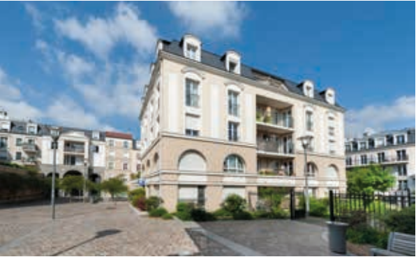
Carré Renaissance - Noisy-le-Grand Architecte : Cabinet Lionel de Segonzac et Cabinet Le Meur