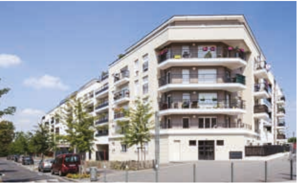
Carré Renaissance II - Noisy-le-Grand Architecte : Atelier au Bord De l'Eau