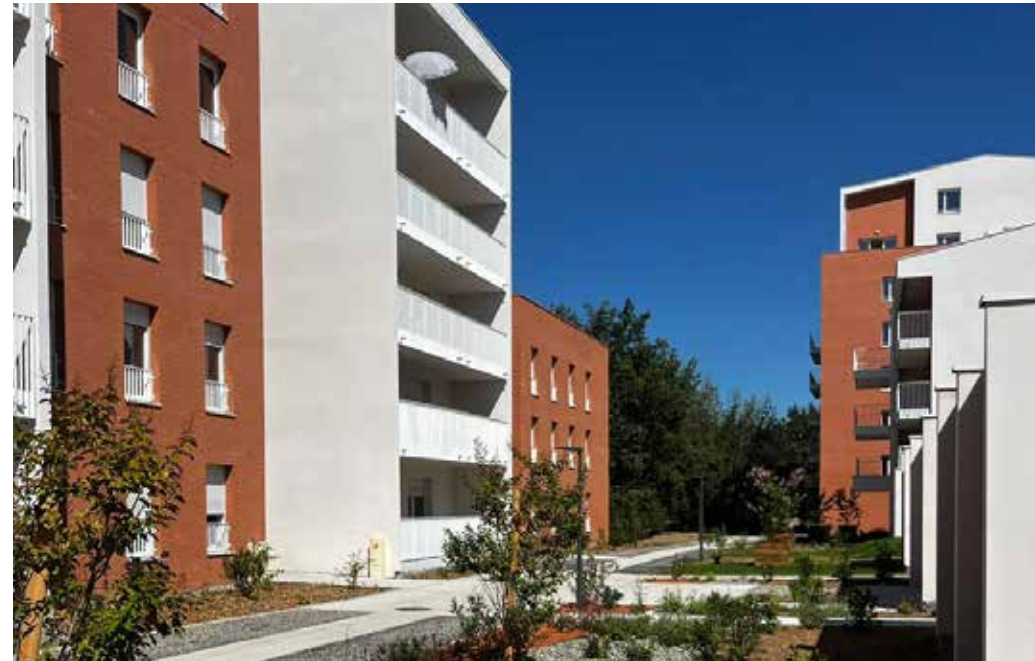
Vert Eden à Toulouse Architecte : Groupe A et Syn Architectures