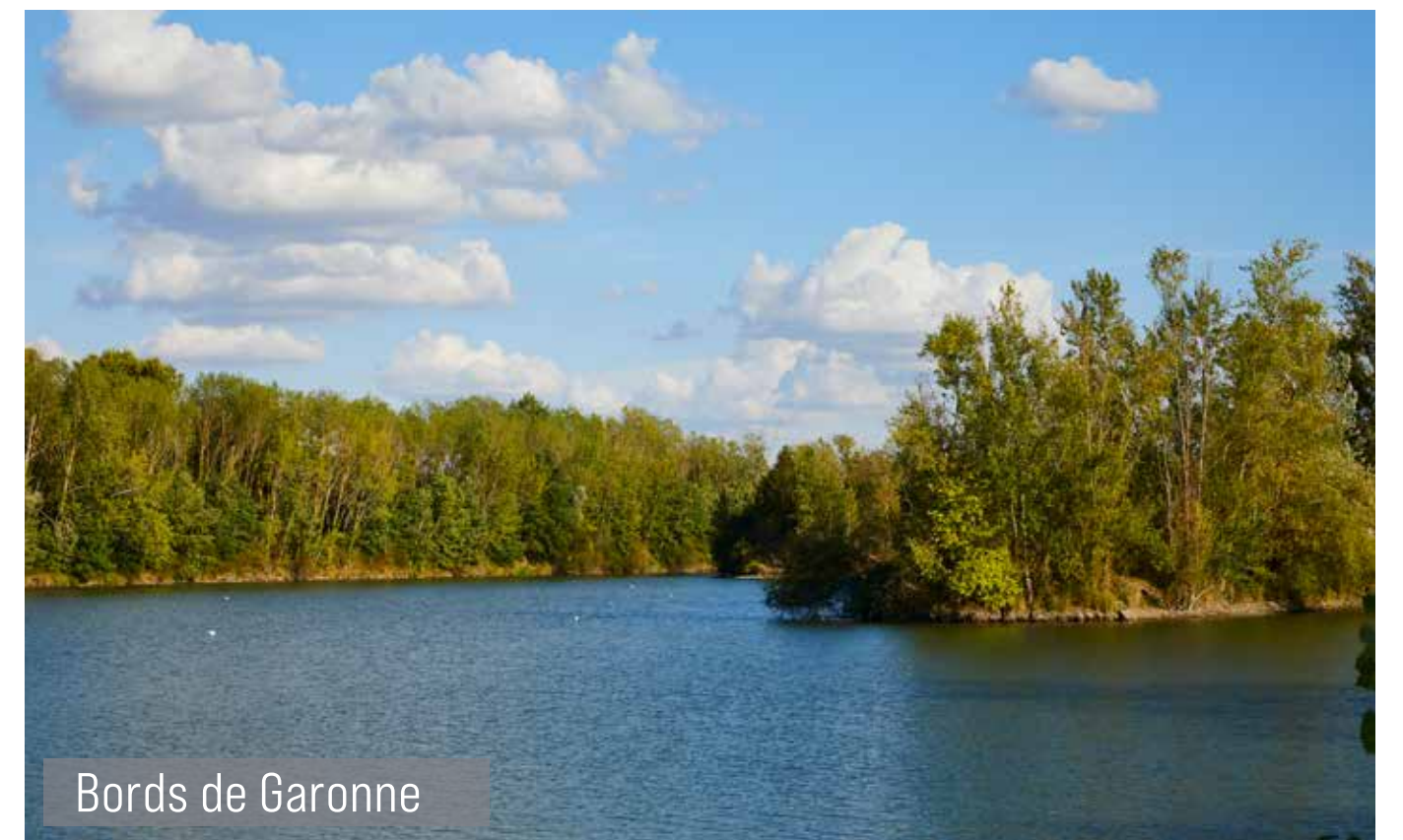
Bords de Garonne