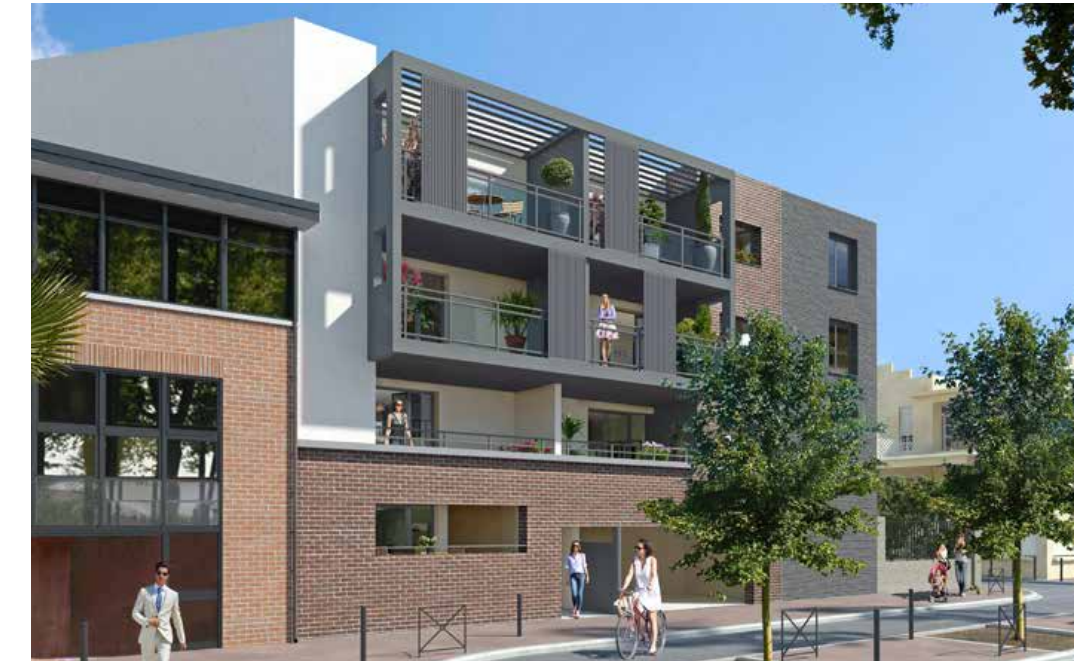
L'Écrin Brienne à Toulouse Architecte : Jean Gombert