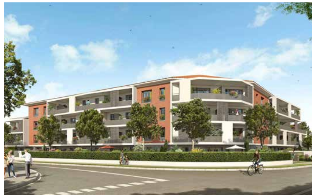
Villa Garance à Castanet-Tolosan Architecte : AMPM Architectes