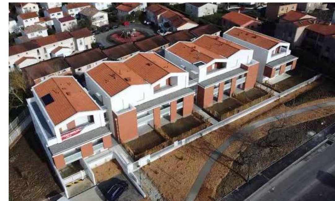
Confidence Balma à Balma Architecte : Agence ABC Architecture