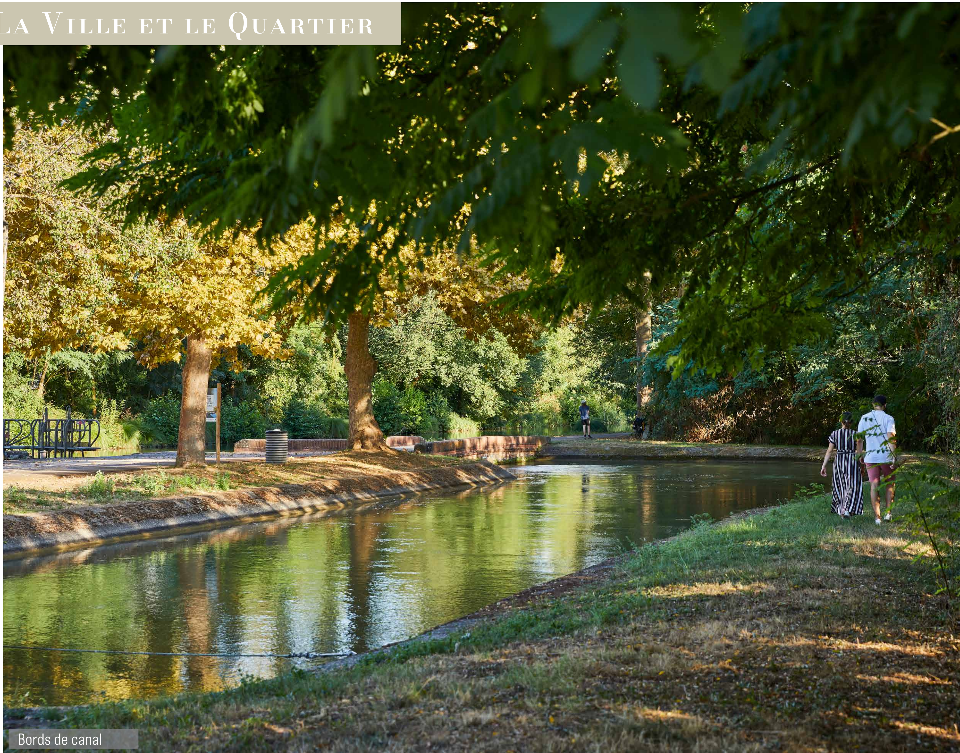
Bords de canal