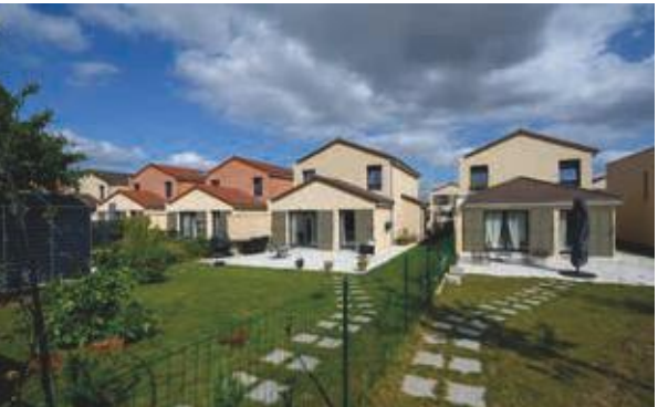
Les Allées De Beauvoir à Corneilles-en-Parisis (95) Architecte : Agence d'architecture ZAD