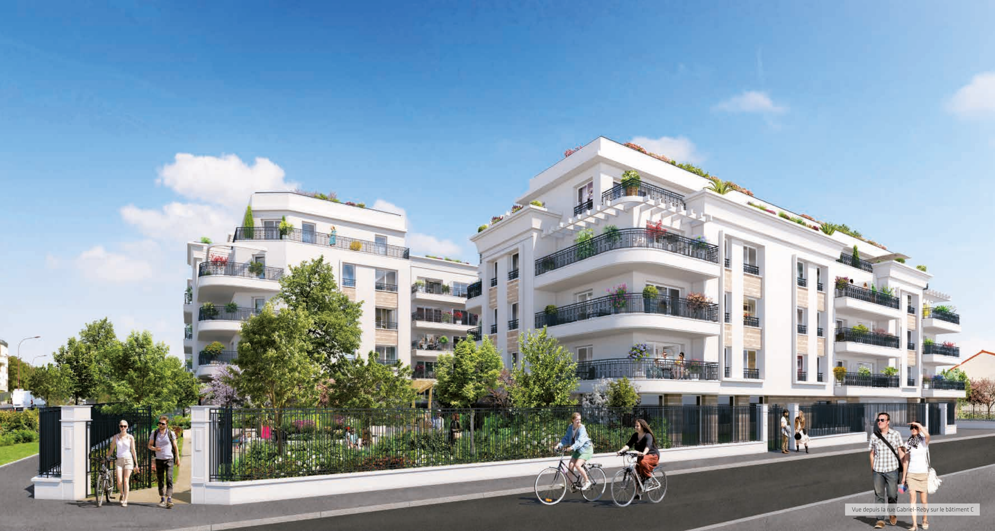
Vue depuis la rue Gabriel-Reby sur le bâtiment C