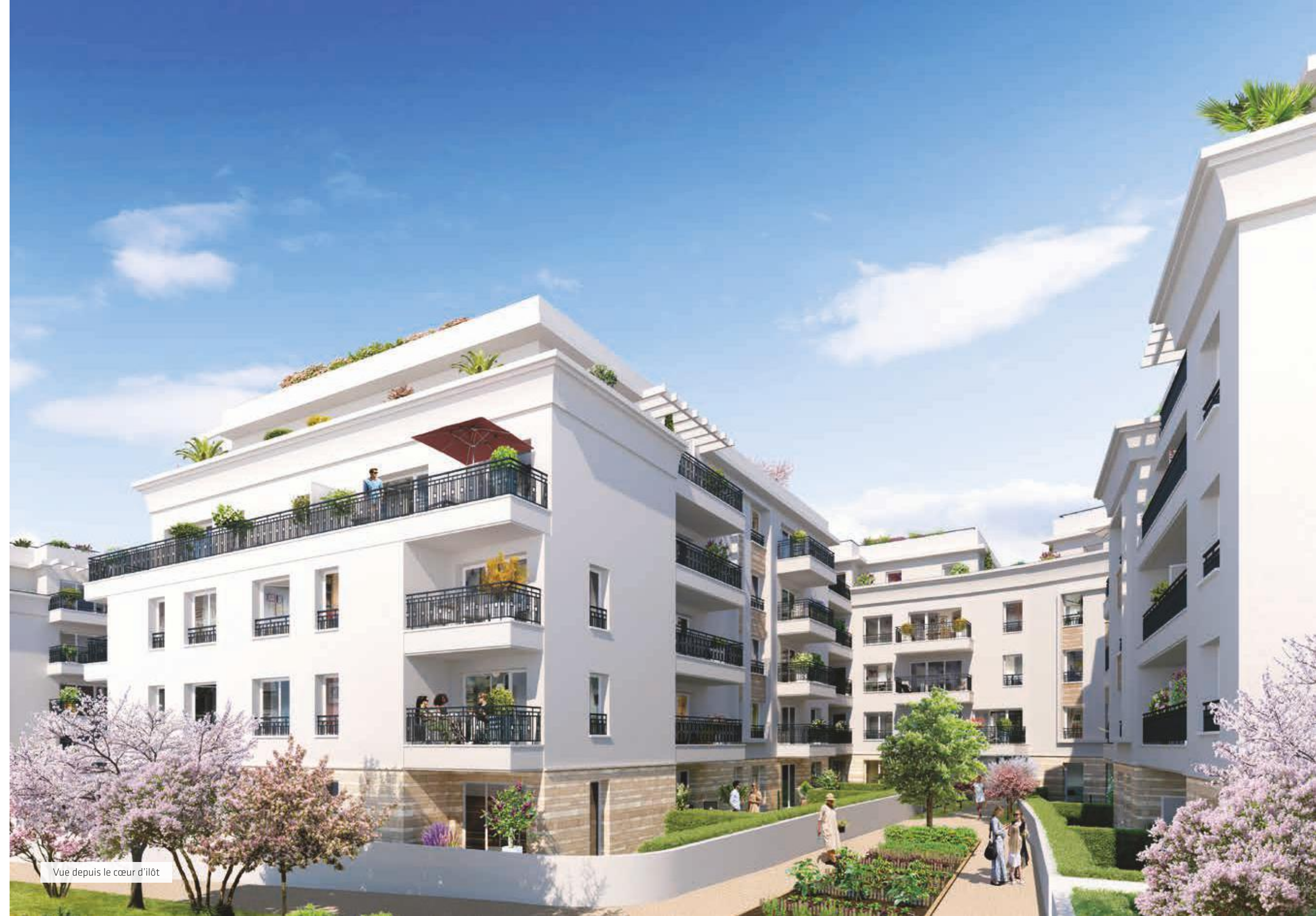
Vue depuis le cœur d'îlot

L'écriture de cette réalisation élégante a été imaginée par l'agence EBSG Architectes et témoigne d'un grand soin du détail. Celui-ci se matérialise au niveau de la forme courbe distinguant les angles des bâtiments, des éléments décoratifs de façade, des garde-corps en métal ouvragé ou encore des pergolas du dernier étage animant les volumes d'ombres projetées. Rythmées par des jeux d'avancées et de retraits, les 3 unités résidentielles composant le projet sont mises en valeur par des séquences en parement de pierre naturelle claire et en enduit blanc.