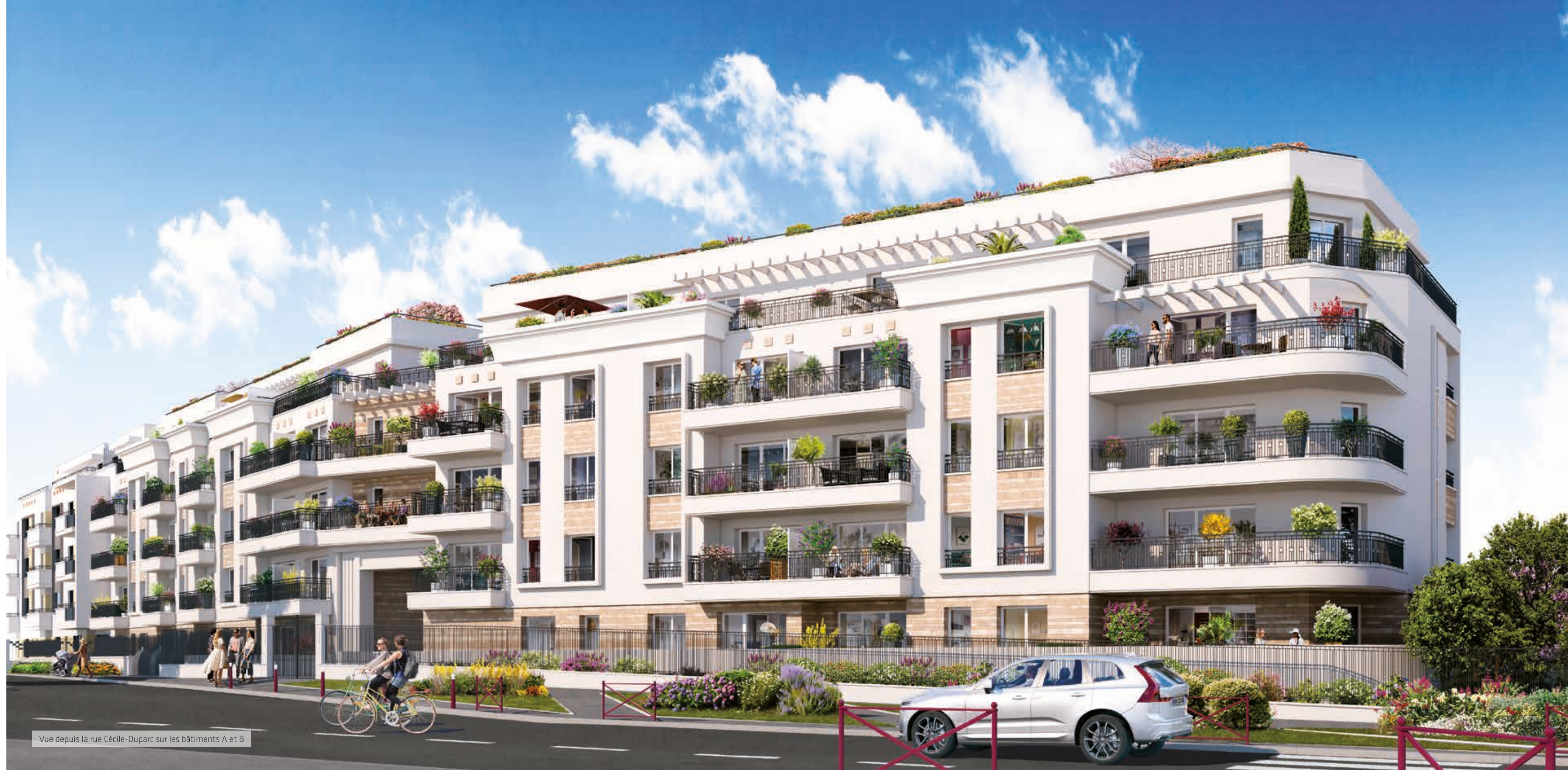
Vue depuis la rue Cécile-Duparc sur les bâtiments A et B