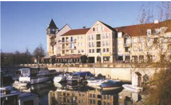
Port Cergy à Cergy (95) Architecte : François Spoerry