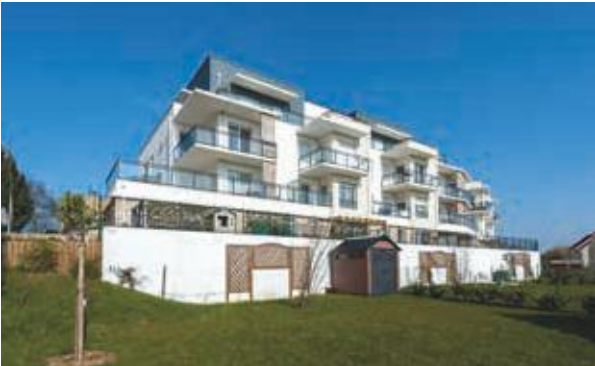
Les Terrasses de Domont à Domont (95) Architecte : Atelier BLM : Elliott Laffitte