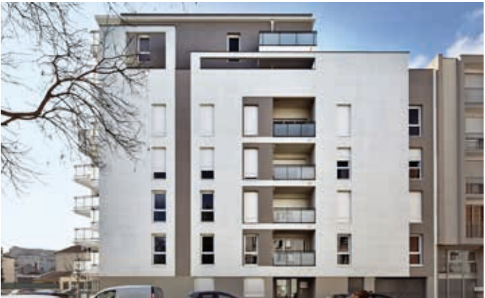
Lyon 7 - 6 avenue Jean-François Raclet Architecte : Unanime Architectes