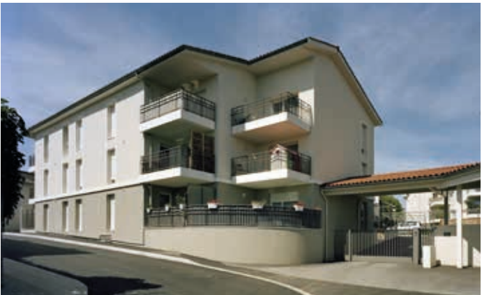
Vourles - Côté Parc Architecte : Maurice Angel