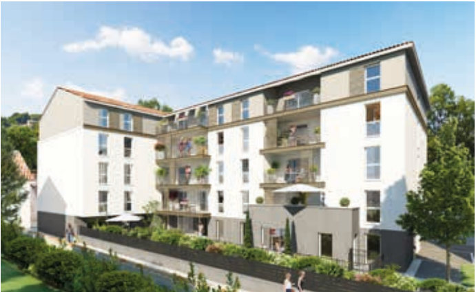
Chasse-sur-Rhône - Les Balcons du Centre Architecte : Atelier William Teissier Architecte