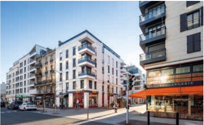
26 rue de Paris - Joinville-le-Pont Architecte : Smaïn Barka