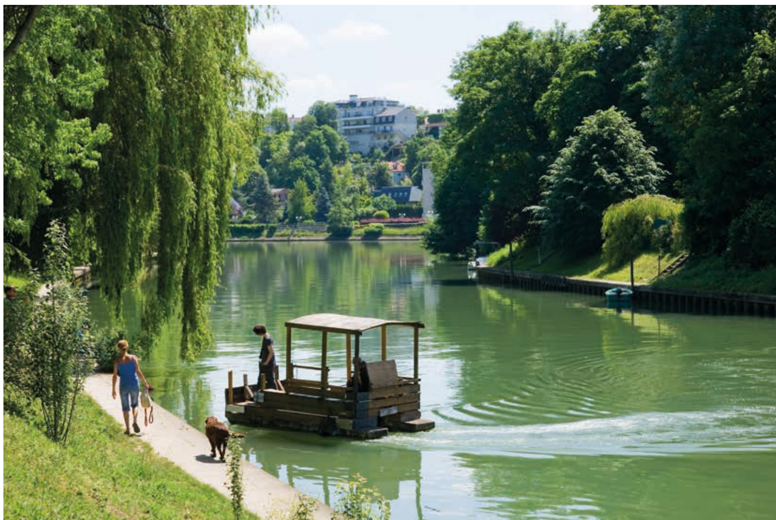
LE PERREUX-SUR-MARNE, LA PERLE DE L'EST PARISIEN POUR UN ART DE VIVRE PAISIBLE...