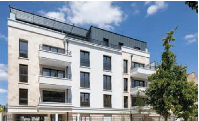
Villa Flora - Fontenay-sous-Bois Architecte : A2D Architecture