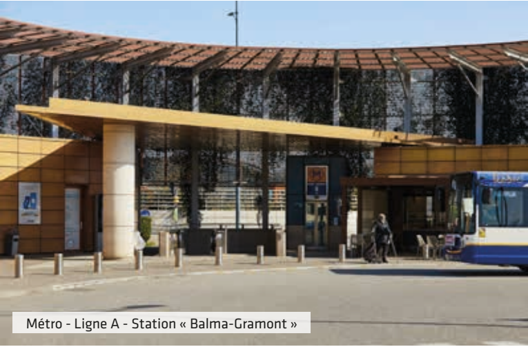
Métro - Ligne A - Station « Balma-Gramont »