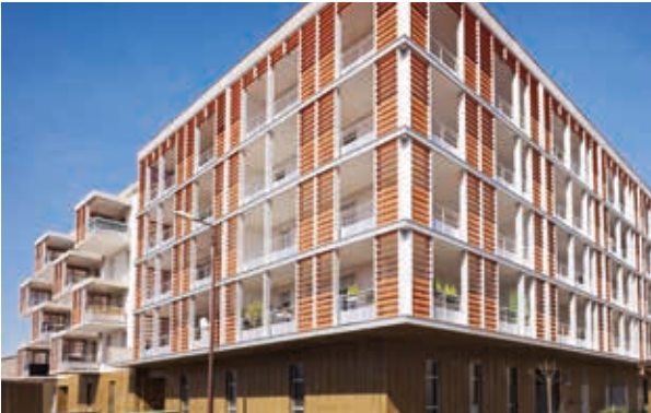
Magellan - Toulouse Architecte : Sutter - Taillander