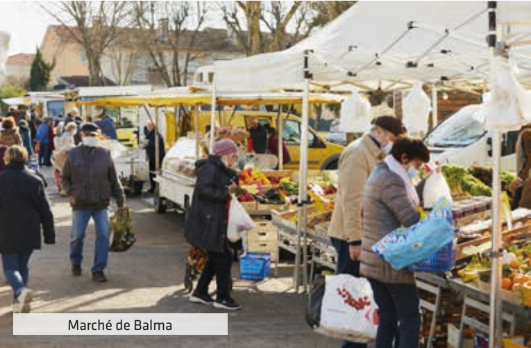
Marché de Balma

C'est une adresse recherchée, dans un quartier résidentiel à 500 m du cœur balmanais et de ses commerces, que vous réserve Confidence Balma . Qu'il est agréable d'aller à pied à la boulangerie, au marché ou chez les professionnels de santé ! Quel plaisir de pouvoir accompagner vos petits à la crèche ou au groupe scolaire Marie-Laurencin dans les 650 m et de laisser vos adolescents se rendre au collège Jean-Rostand, en toute autonomie, à 850 m ! Pour les courses ? Le supermarché est à 1 km. Actifs ? Presque à votre porte, le bus vous conduit rapidement dans la zone d'activités de Balma-Gramont ou au métro A.