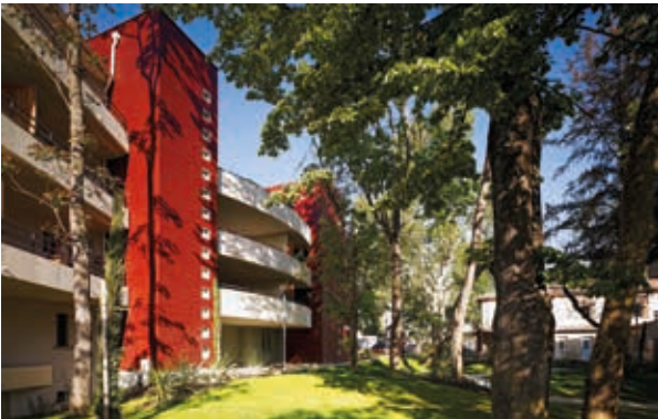
Les Jardins du Golf - Toulouse Architecte : Ryckwaert