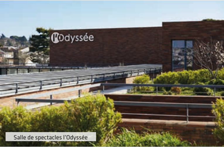
Salle de spectacles l'Odyssée