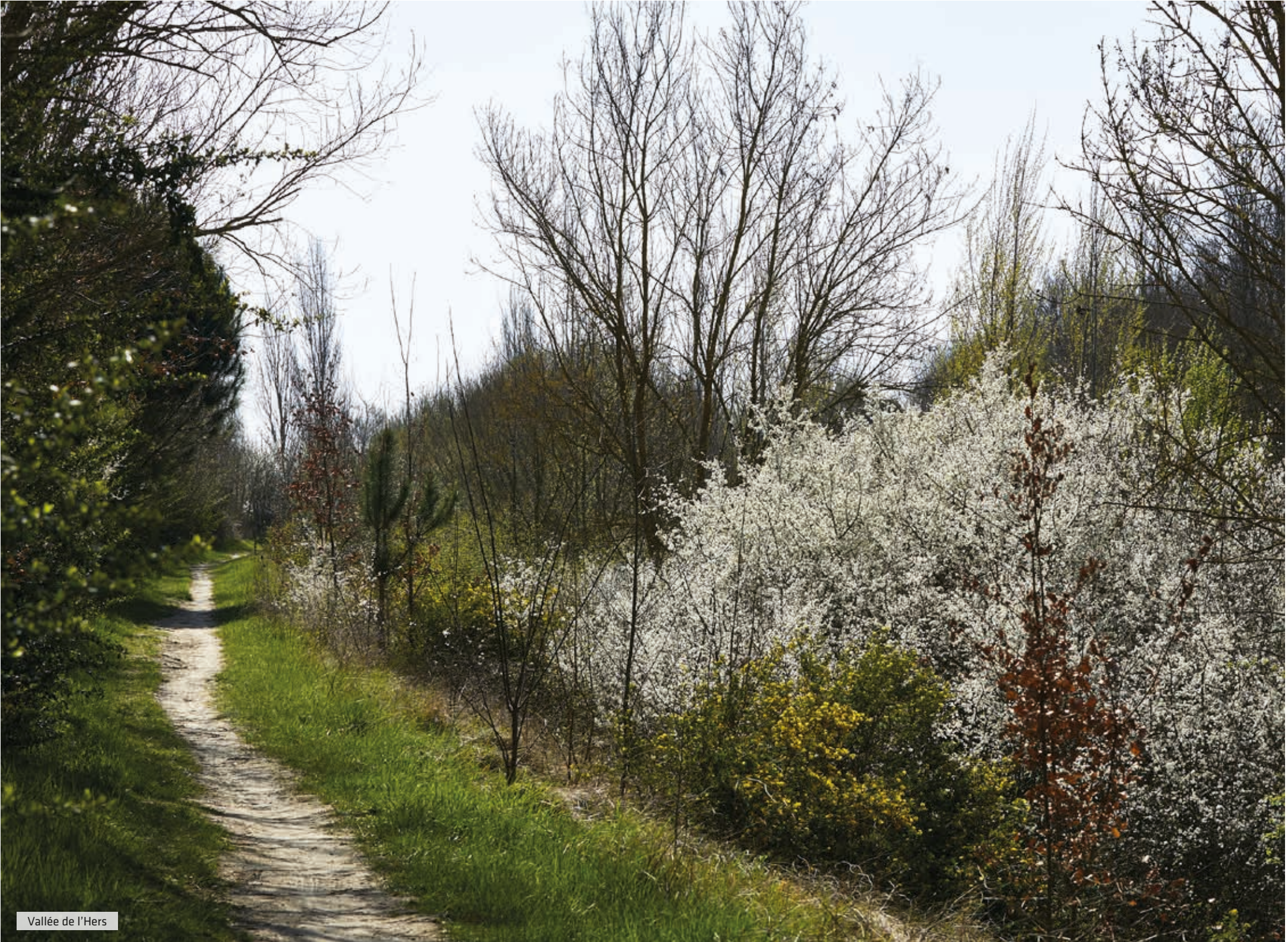
Vallée de l'Hers

Ponctuée de plus de 60 ha d'espaces verts, sillonnée de sentiers et de pistes cyclables, dotée d'un lac et de plus de 30 aires de jeux pour les enfants, la commune respire le bien-être.