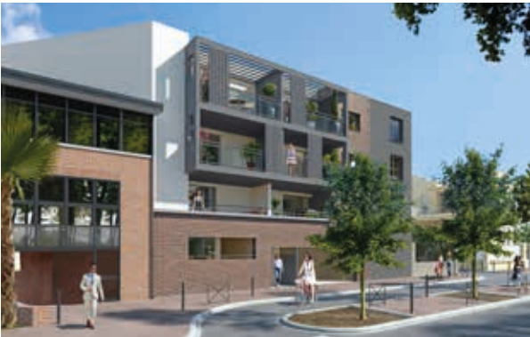
L'Écrin Brienne - Toulouse Architecte : Jean Gombert