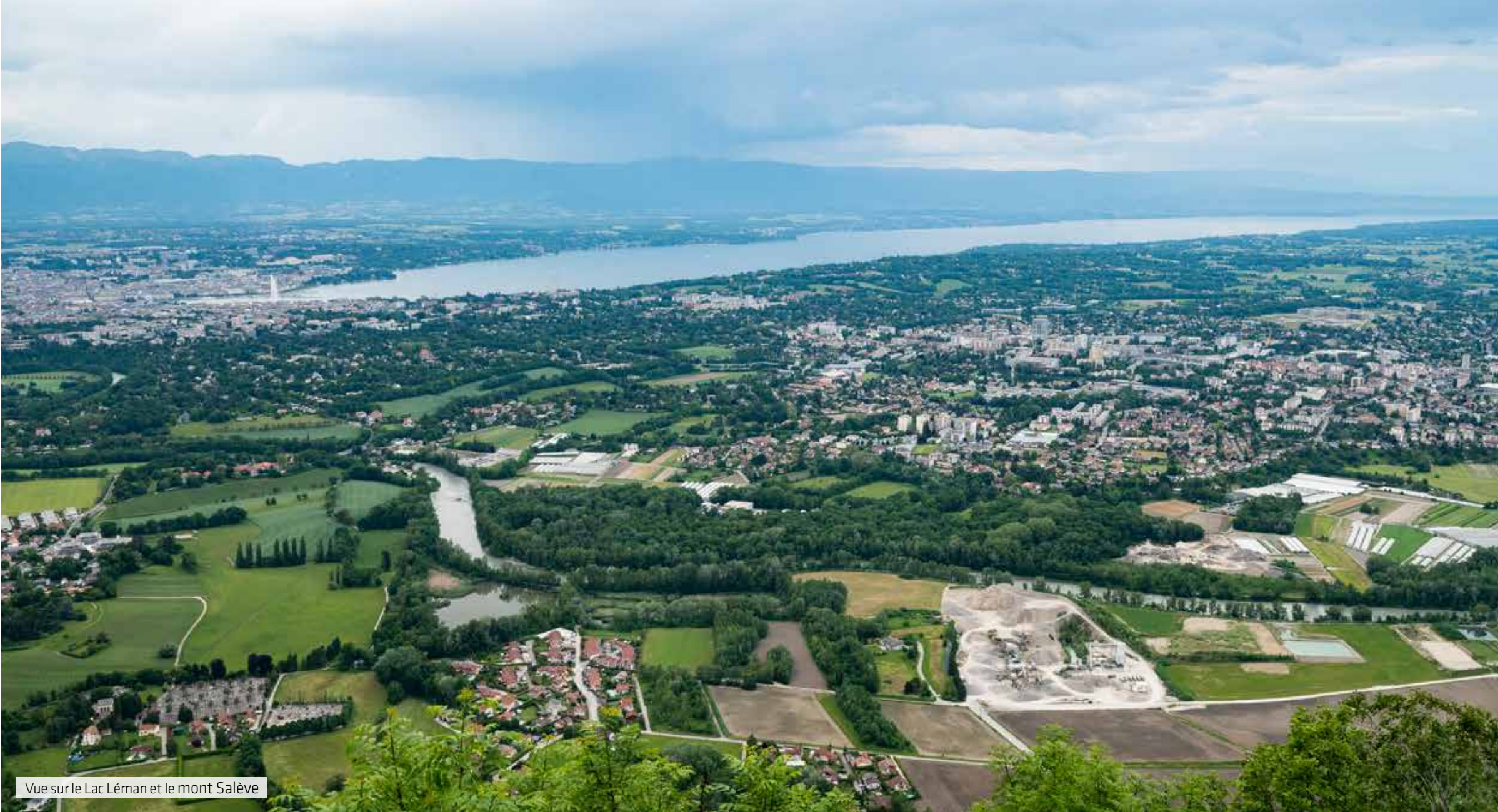
Vue sur le Lac Léman et le mont Salève

Émaillée d'espaces verts (parcs Jean-Beauquis et du Clos Babuty, berges du Foron...) participant à son agréable qualité de vie, Ambilly profite d'un cadre naturel incomparable. La proximité du lac Léman, des massifs du Voiron et du Salève, ainsi que des stations de ski (Le Grand-Bornand, Les Carroz...) à 45 min de route font le rêve des amateurs de loisirs outdoor !