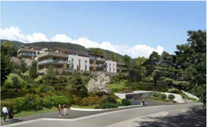
Sévrier - Les Terrasses du Lac Agence d'Architecture Yves Poncet & David Ferré