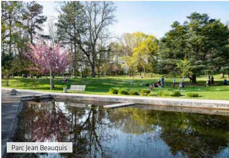
Parc Jean Beauquis

En s'installant dans le quartier Croix d'Ambilly, en lisière d'Annemasse, Cœur Ambilly vous invite à profiter des atouts conjugués de 2 communes. Prêts à vous faire gagner un temps précieux, supermarché, petits commerces, services, marché et boutiques du centre-ville annemassien vous attendent dans les 750 m.