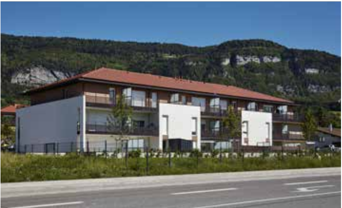
Beaumont - Terrasses Bellevue Agence d'Architecture David Ferré

Société familiale fondée en 1972 par Olivier Mitterrand, Les Nouveaux Constructeurs s'est imposée comme un acteur de référence dans le domaine de la promotion immobilière. L'expertise et la solidité du groupe reposent sur plus de 80 000 biens livrés, en habitat collectif et individuel, ainsi que sur la commercialisation et la construction de 700 000 m² de bureaux.