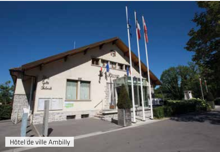
Hôtel de ville Ambilly