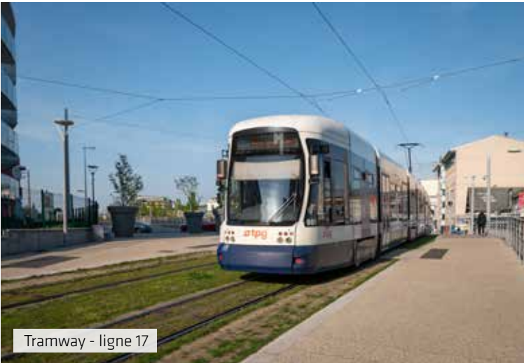
Tramway - ligne 17