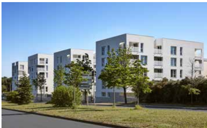
CITY GARDEN - VÉNISSIEUX Architecte : Cabinet Insolites Architectures