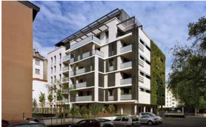
34 RUE LT COL PRÉVOST - LYON 6 ÈME Architecte : Franck Dreidemie