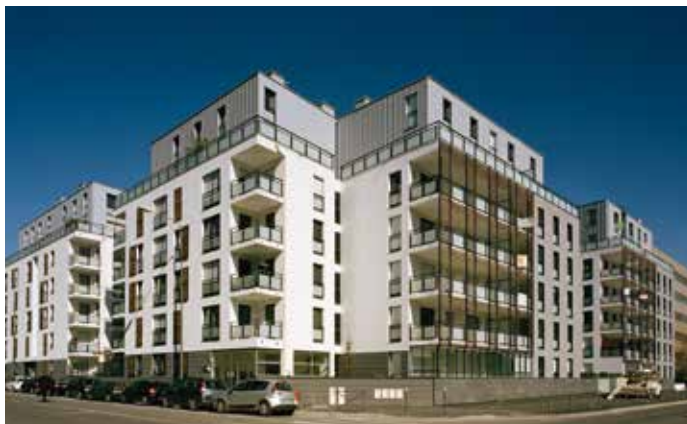
QUAI OUEST - LYON 9 ÈME Architecte : Sud Architectes