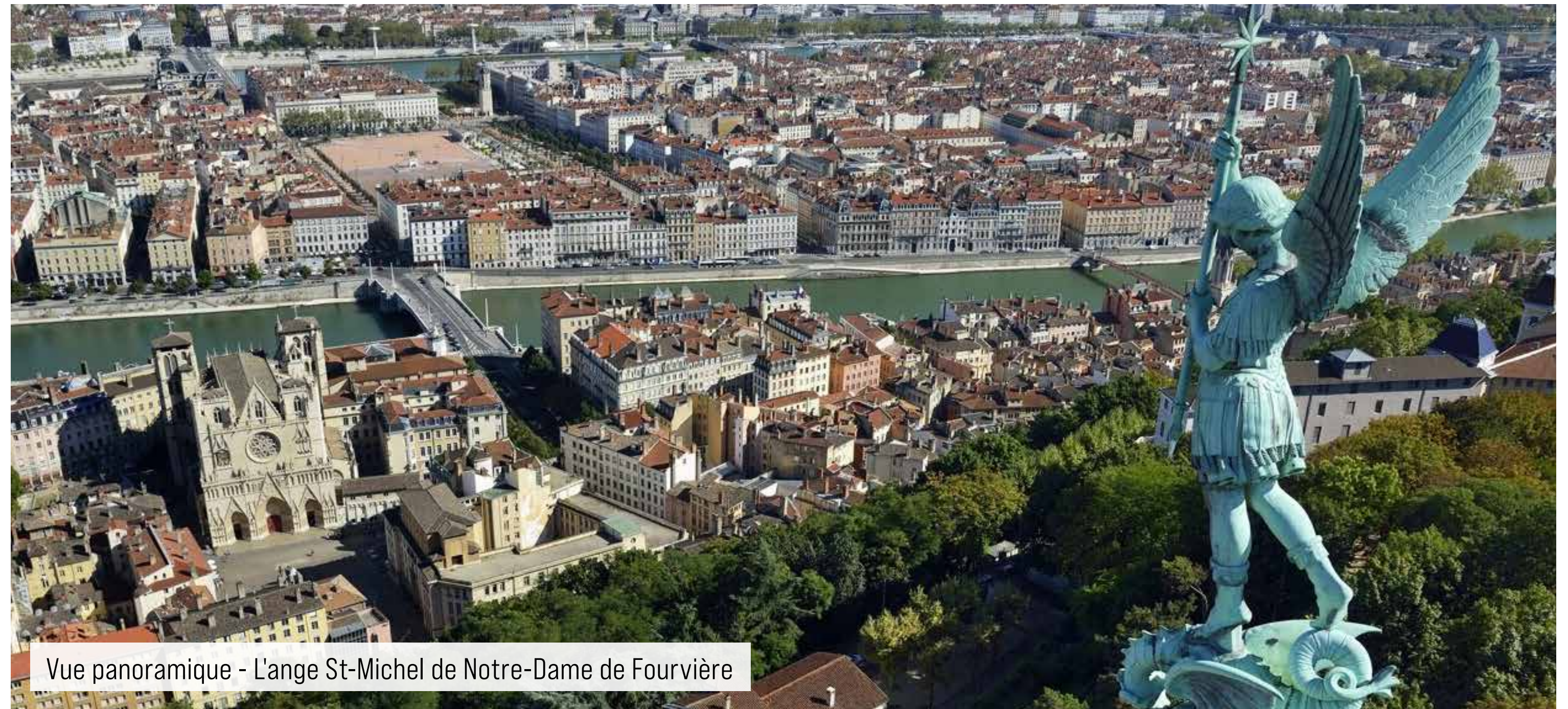
Vue panoramique - L'ange St-Michel de Notre-Dame de Fourvière