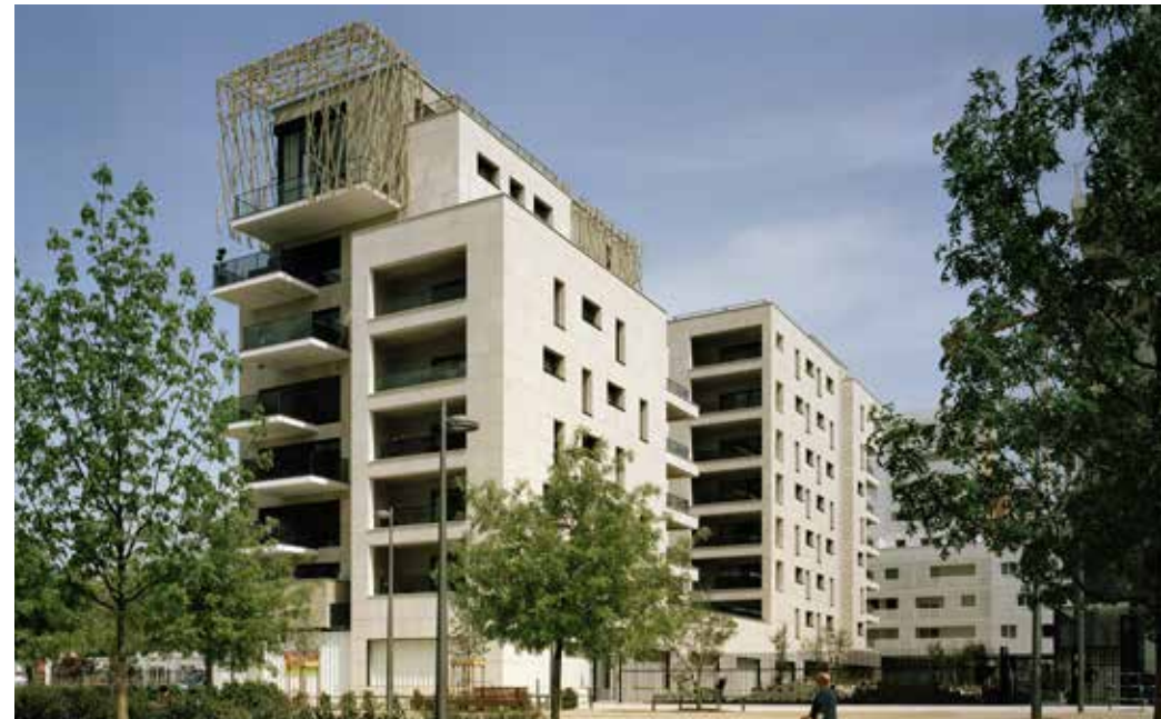
Confluence à Lyon 2° Architecte : Cabinet AFAA