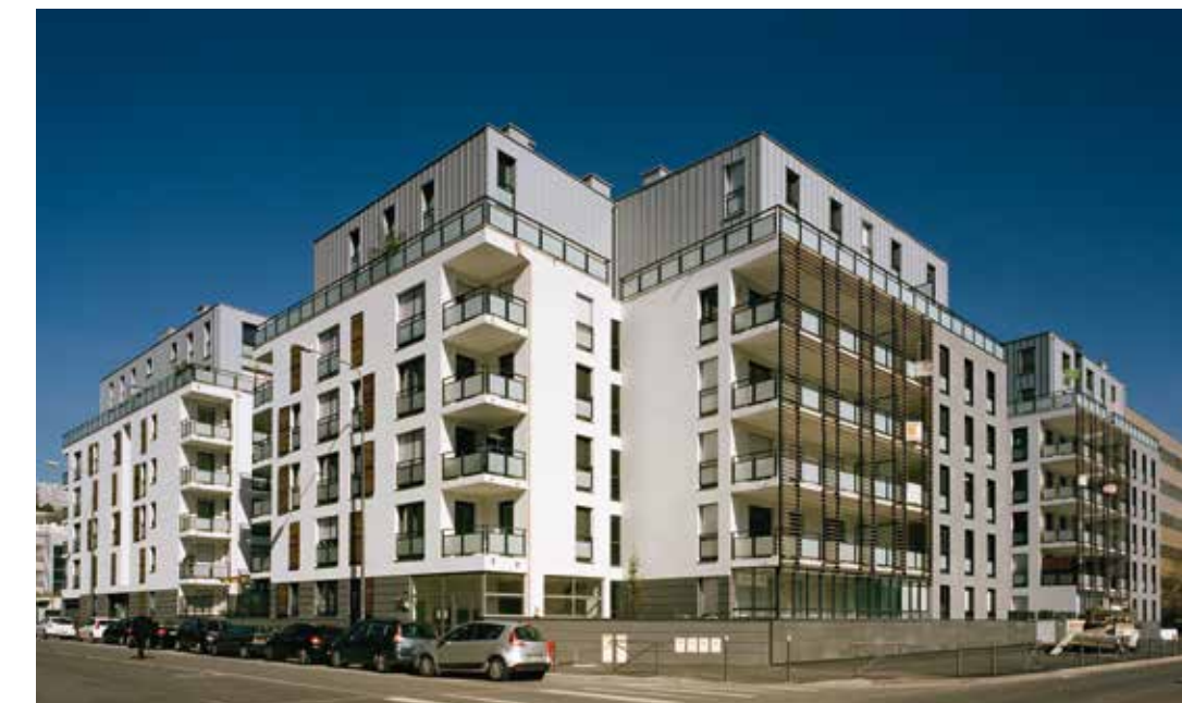
Quai Ouest à Lyon 9° Architecte : Sud Architectes