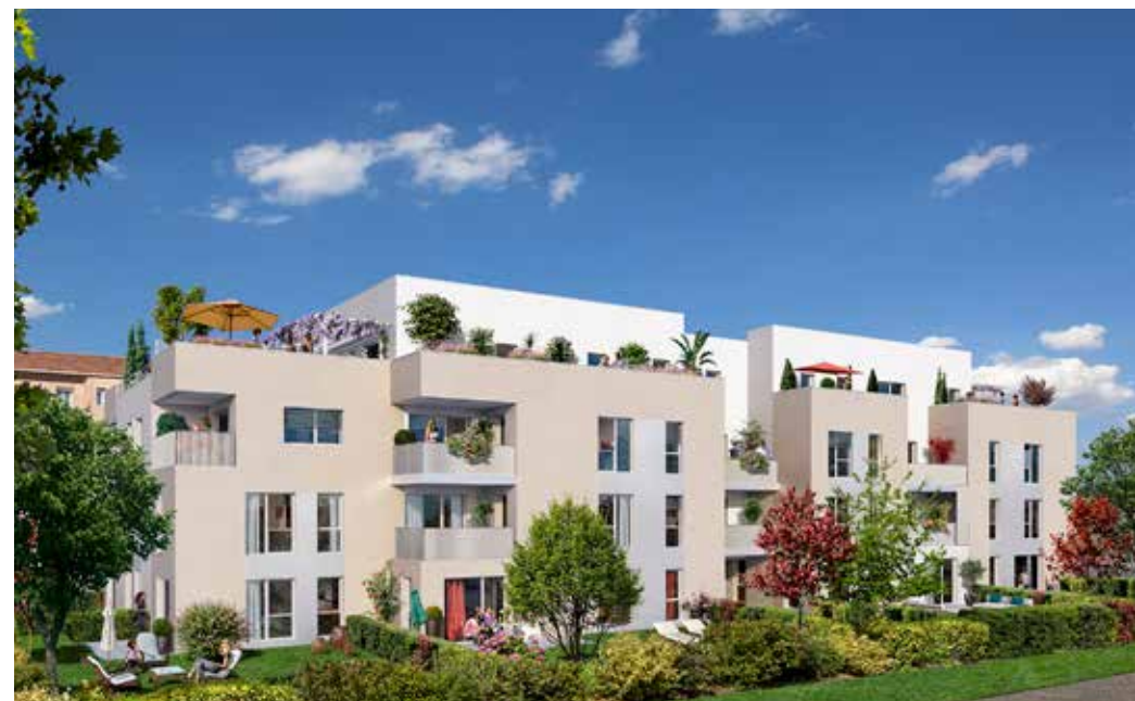
Plain'itude à Lyon 8° Architecte : Jacquet et associés