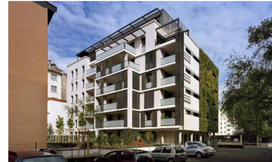
34 rue Lt. Col. Prévost à Lyon 6° Architecte : Atelier Thierry Roche