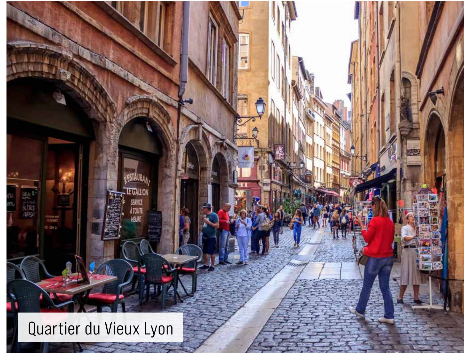
Quartier du Vieux Lyon