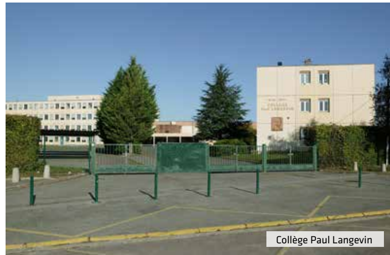
Collège Paul Langevin