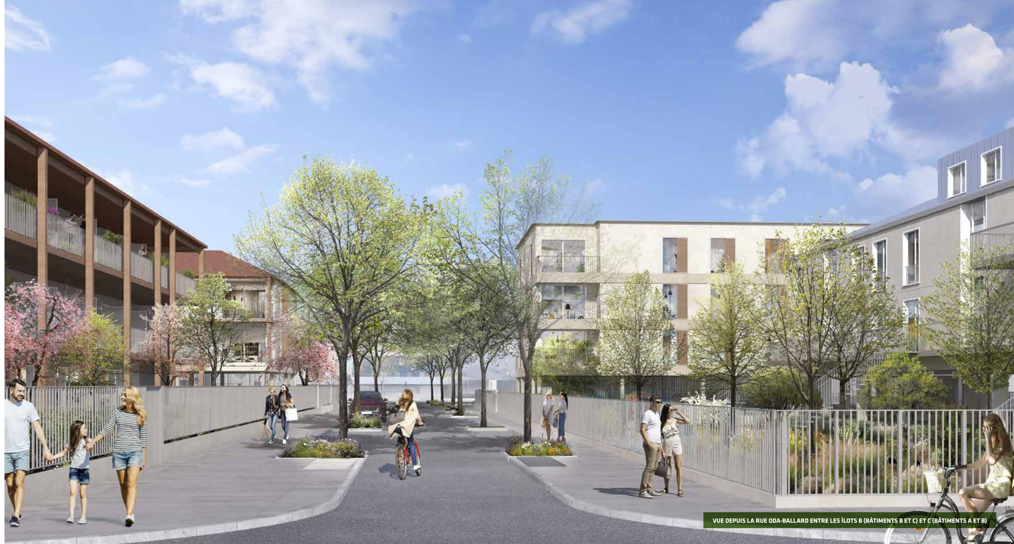
VUE DEPUIS LA RUE ODA-BALLARD ENTRE LES ÎLOTS B (BÂTIMENTS B ET C) ET C (BÂTIMENTS A ET B)

Très agréable à vivre, L'Orée du Parc est un projet aéré par des percées visuelles aménagées entre les constructions depuis les espaces publics, mais aussi intime grâce aux bâtiments enveloppant les cœurs d'îlot de leurs volumes. La générosité des espaces extérieurs privatifs est également très marquante sur ce projet. Elle prend la forme de profonds balcons s'étirant sur toute la longueur des logements, de larges terrasses, de jardins individuels, voire de 2 jardinets arborés pour certains appartements.