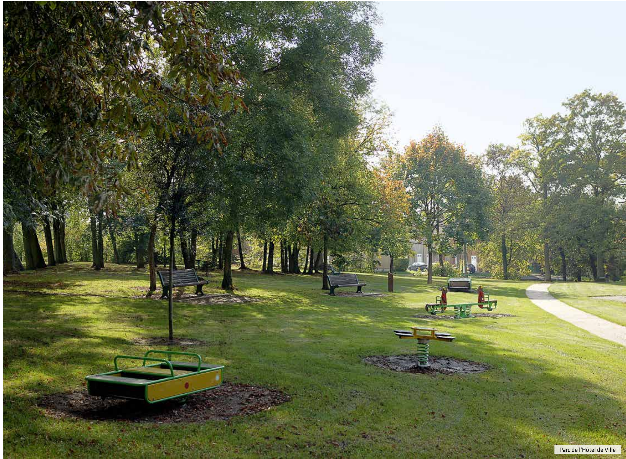
Parc de l'Hôtel de Ville