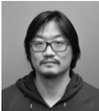
Tae-Hoon Yoon Agence Sathy

En revanche, en façades intérieures, l'atmosphère se fait bucolique. La composition est plus foisonnante, en lien avec l'abondante végétalisation du cœur d'îlot, vers laquelle se tournent les prolongements extérieurs privatifs. Ce caractère généreux s'exprime également par le biais de terrasses ou de balcons distribuant la majorité de ces unités résidentielles. On rentre chez soi par de petits escaliers, et des parties communes ne desservant jamais plus de 4 à 6 appartements. Cette échelle domestique génère un effet d'individualisation des logements qui est très appréciable pour les résidents, au même titre que la configuration traversante qui valorise la plupart des appartements, et ce, dès le 2 pièces. »