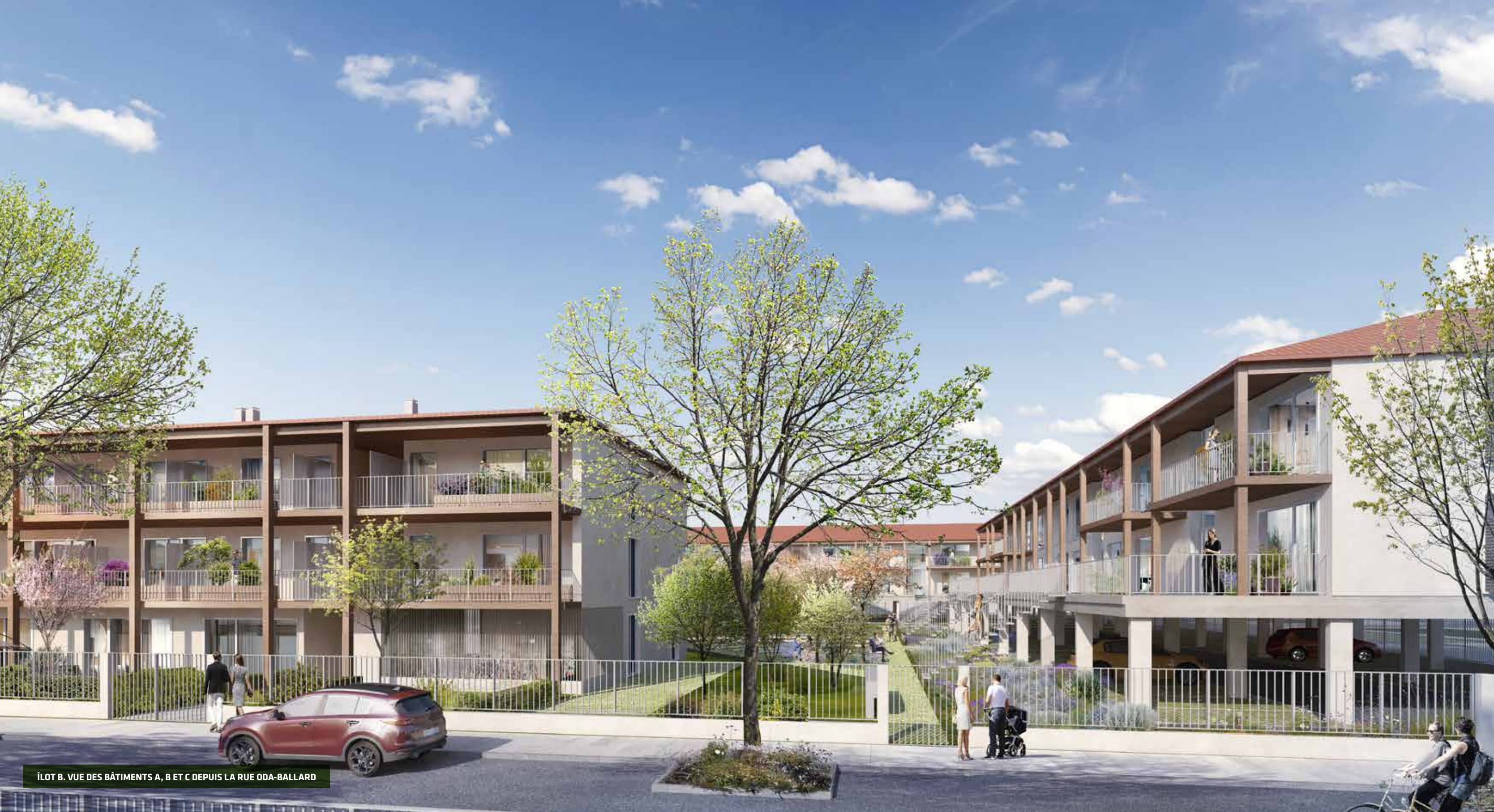
ÎLOT B. VUE DES BÂTIMENTS A, B ET C DEPUIS LA RUE ODA-BALLARD

Une architecture à taille humaine, entre modernité et tradition