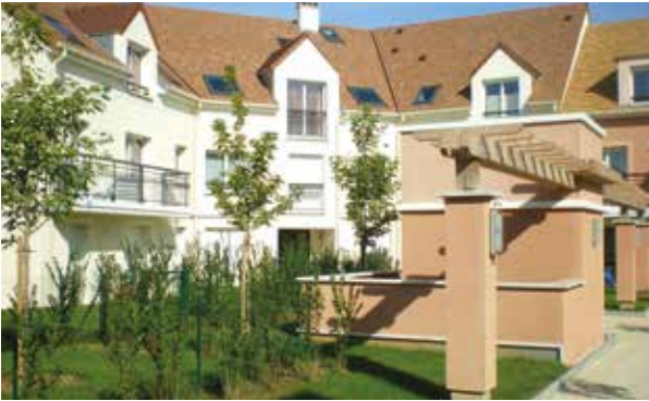
L'Orangerie - Chevry Cossigny Architecte : Mermet