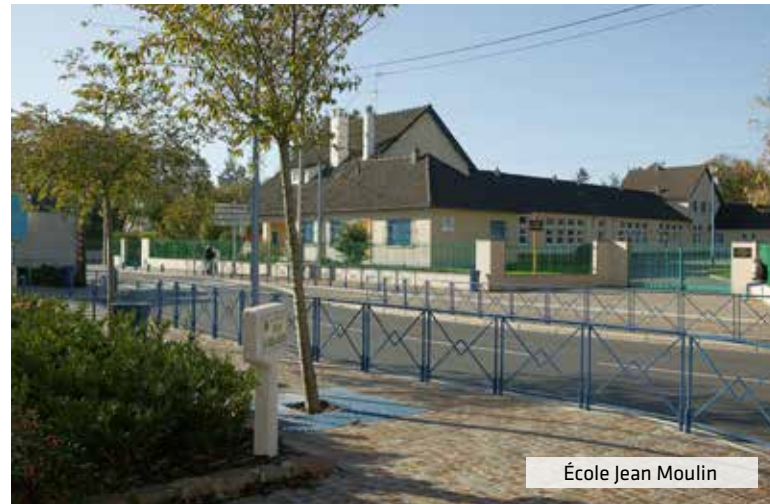
École Jean Moulin