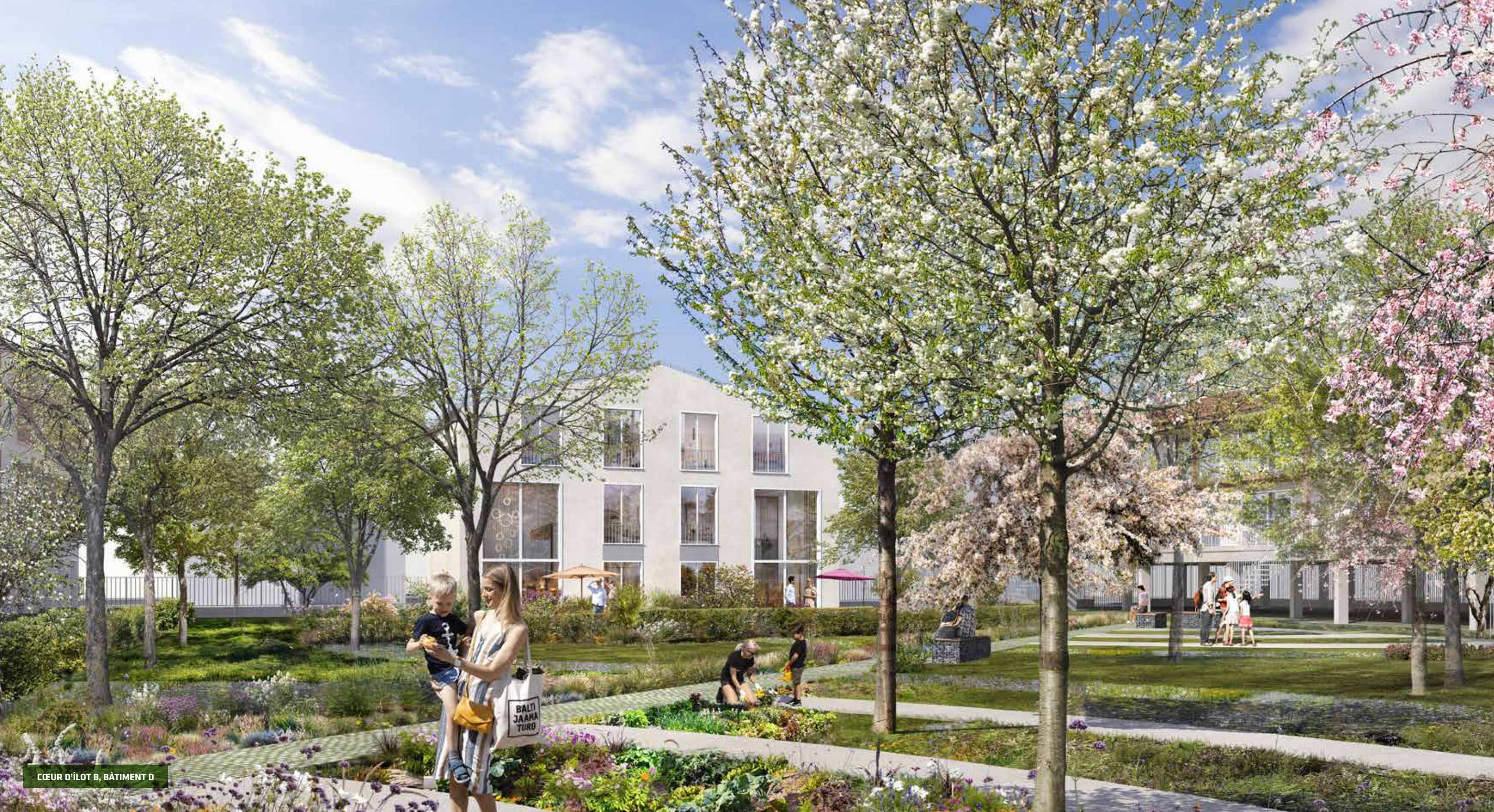
CŒUR D'ÎLOT B, BÂTIMENT D