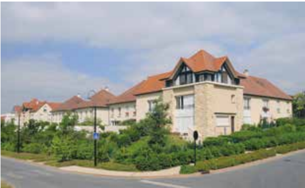
Chessy Village - Chessy Architecte : Lionel De Segonzac