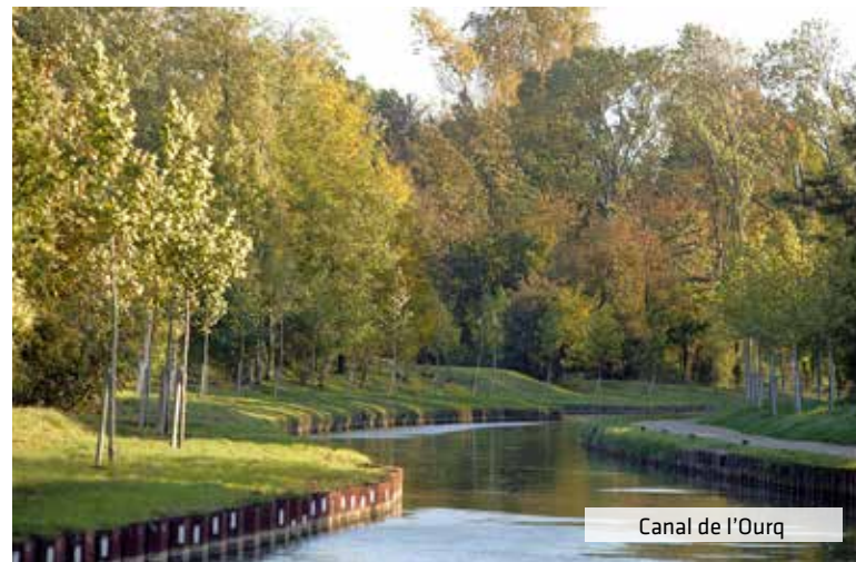
Canal de l'Ourq