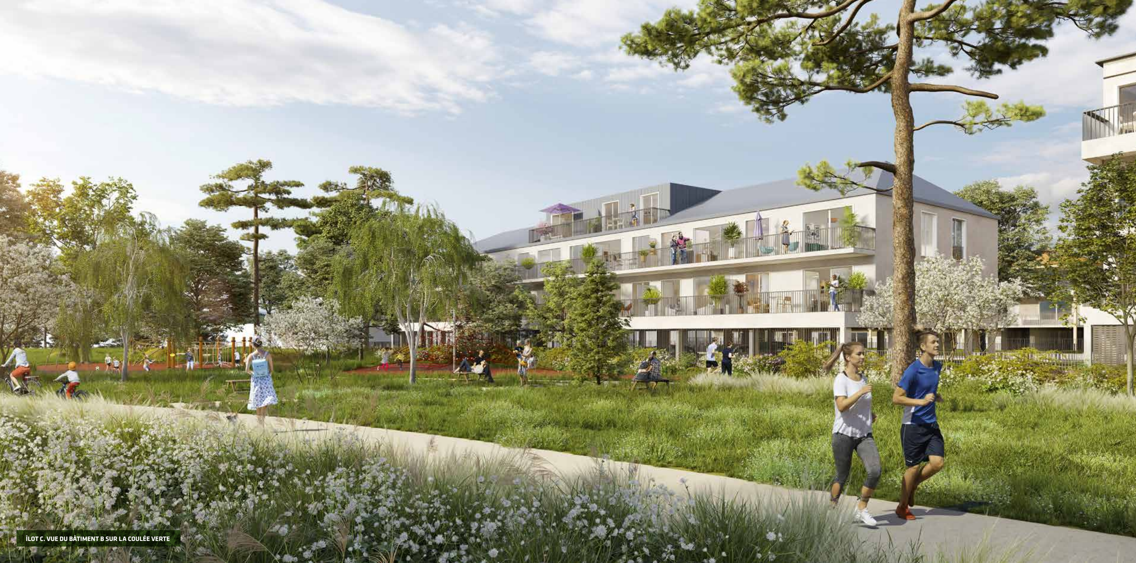
ÎLOT C. VUE DU BÂTIMENT B SUR LA COULÉE VERTE