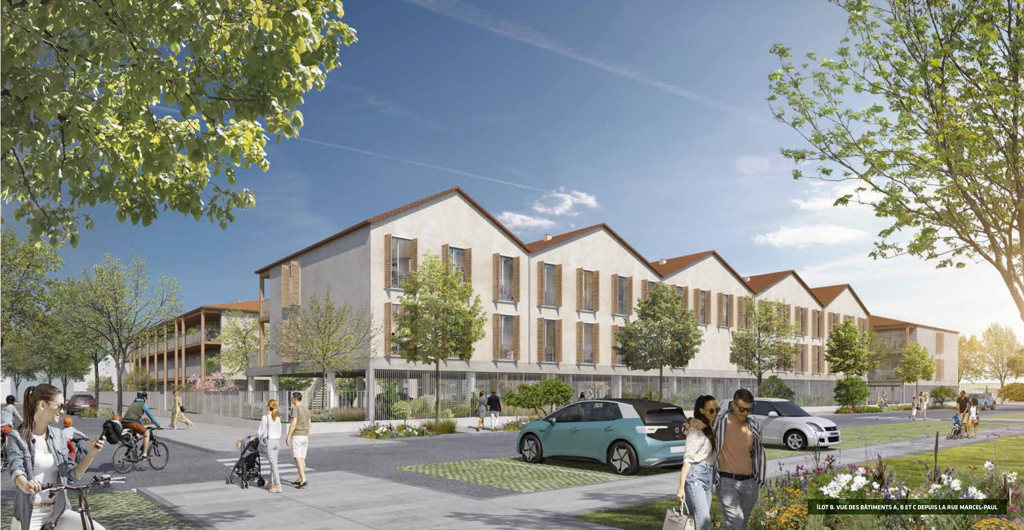
ÎLOT B. VUE DES BÂTIMENTS A, B ET C DEPUIS LA RUE MARCEL-PAUL