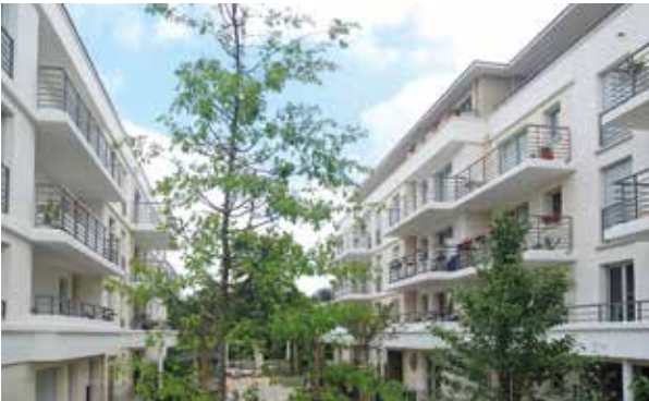
Les Jardins de Noisiel - Noisiel Architecte : Atelier GERA