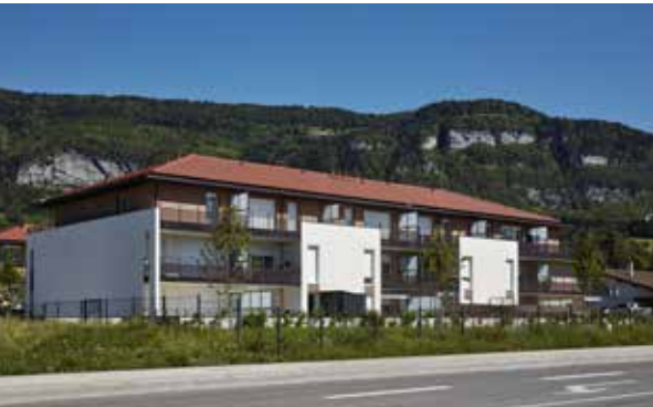
Beaumont - Terrasses Bellevue Agence d'Architecture David Ferré