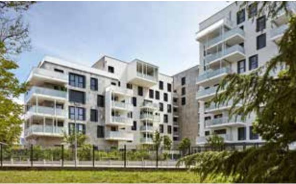
Les Terrasses d'Helvétie - Ambilly Agence d'Architecture Oworkshop