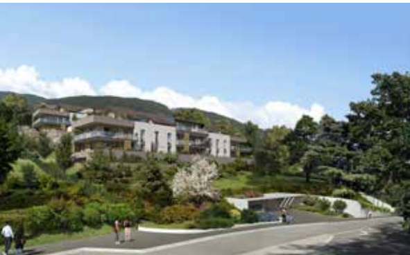
Sévrier - Les Terrasses du Lac Agence d'Architecture Yves Poncet & David Ferré