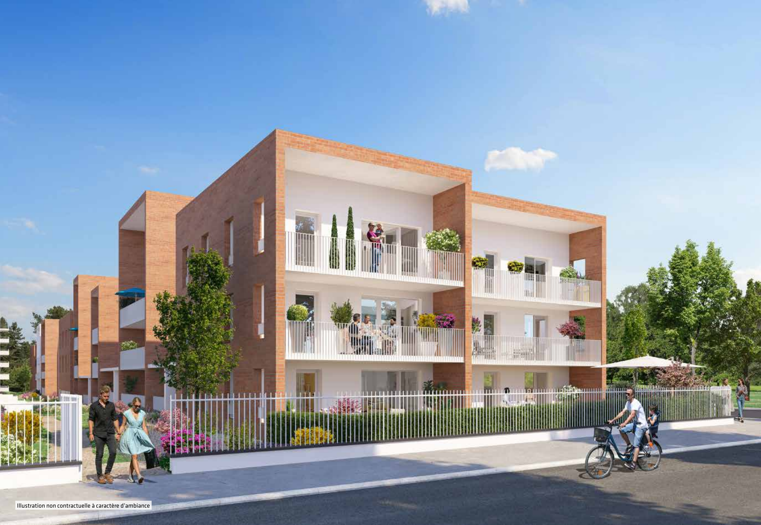
Illustration non contractuelle à caractère d'ambiance

Les différentes unités résidentielles de Vert Eden présentent un traitement architectural soigné et harmonieux. Leur écriture sobre fait le lien entre tradition toulousaine et inspiration contemporaine. Leurs façades sont rythmées par un jeu de 2 enduits (gris clair ou blanc pour les fonds de loggias, avec blanc en rappel pour les murs extérieurs), associé à des séquences en parement de briques de teinte naturelle. Réalisés en métal, les garde-corps des prolongements extérieurs ajoutent une touche de légèreté à l'ensemble.