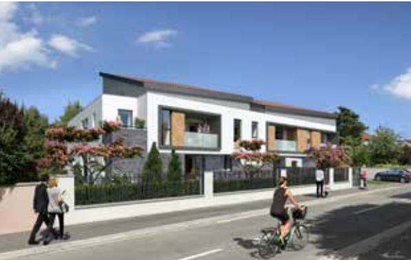
Le Domaine des Cyprès - Colomiers Architecte : Hervé Saintis