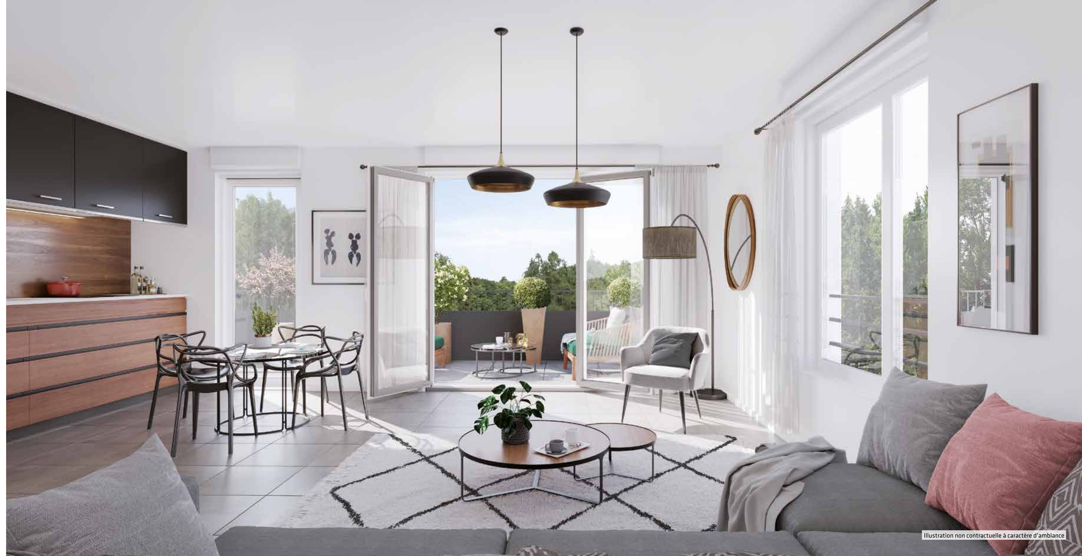
Illustration non contractuelle à caractère d'ambiance

Vert Eden propose des appartements du 2 au 4 pièces, ainsi que des maisons 3 et 4 pièces. Ces espaces de vie sont fonctionnels et personnalisés, afin de vous offrir tout le confort requis. Imaginez de beaux volumes, habillés par des matériaux de grande qualité choisis avec soin, qui révèlent toute leur élégance. La générosité des vitrages assure bien-être et apport solaire passif permettant de réaliser des économies d'énergie. En complément aux espaces verts animant les cœurs d'îlot, chaque logement bénéficie d'au moins un prolongement extérieur privatif : jardin individuel, balcon, loggia, terrasse.