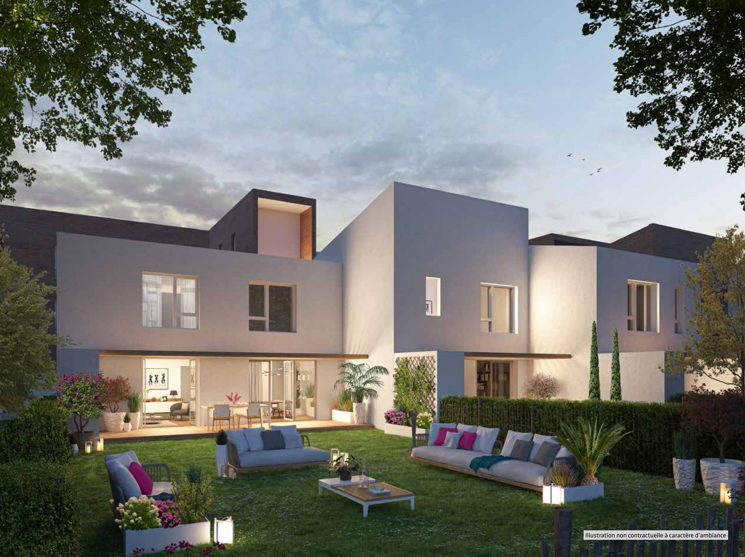
Illustration non contractuelle à caractère d'ambiance

Sur l'arrière, place est faite à la vie privée. La terrasse aménagée, ombragée par une pergola en bois, borde un plaisant jardin privatif, se développant dans la confidentialité de haies vives. Envie de petit-déjeuner en famille au grand air ou de recevoir des amis au clair de lune ? Vous n'avez qu'un pas à faire pour profiter, de nombreux mois de l'année, du beau temps de l'Occitanie