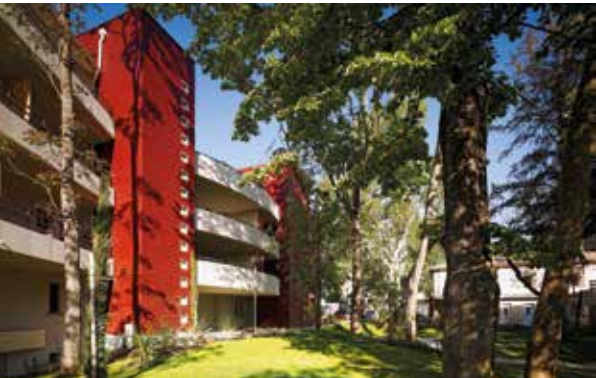
Les Jardins du Golf - Toulouse Architecte : Ryckwaert