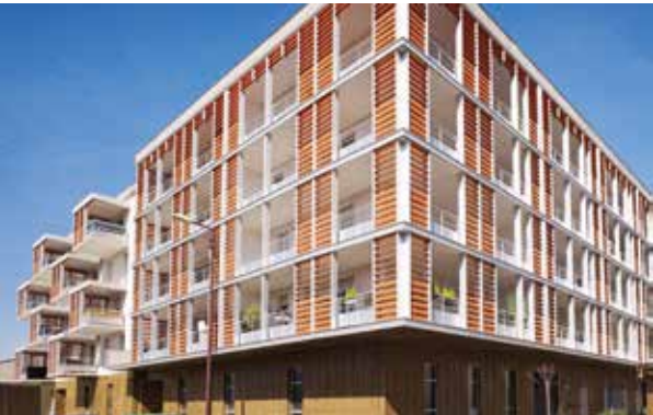
Magellan - Toulouse Architecte : Sutter - Taillander