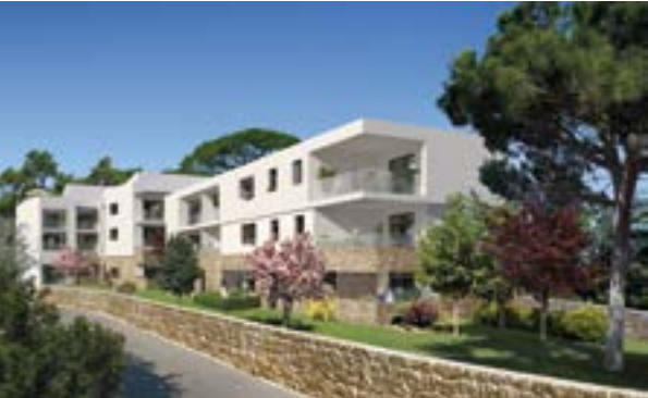
Cœur Castelnau - Castelnau-le-Lez Architecte : EXO 7