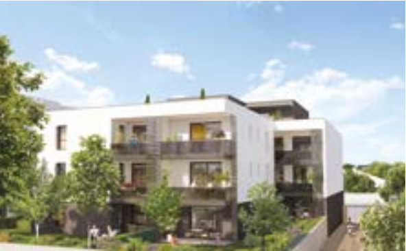
Villa Opaline - Castelnau-le-Lez Architecte : Jérôme Rio

L'acquisition d'un appartement ou d'une maison est un acte engageant dans une vie. Pour mener à bien votre projet et faire de cet investissement un lieu qui vous ressemble, nos collaborateurs vous accompagnent depuis le financement jusqu'à la livraison de votre logement.