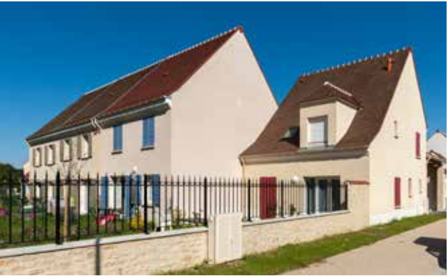
Tigery Village - Tigery Architecte : Xavier BOHL