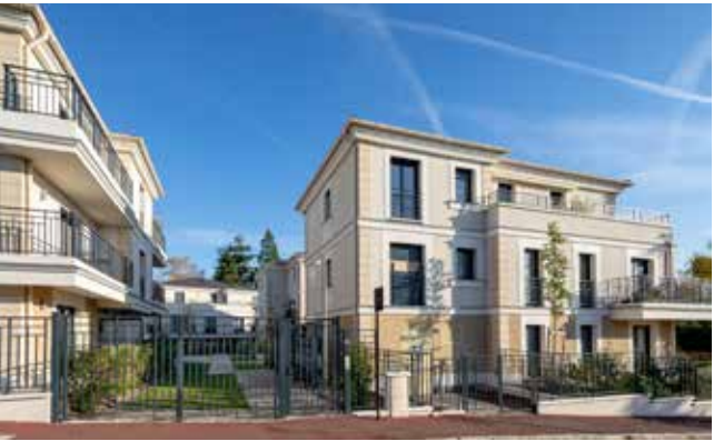
Le Domaine du Roy - Viroflay Architecte : ACP