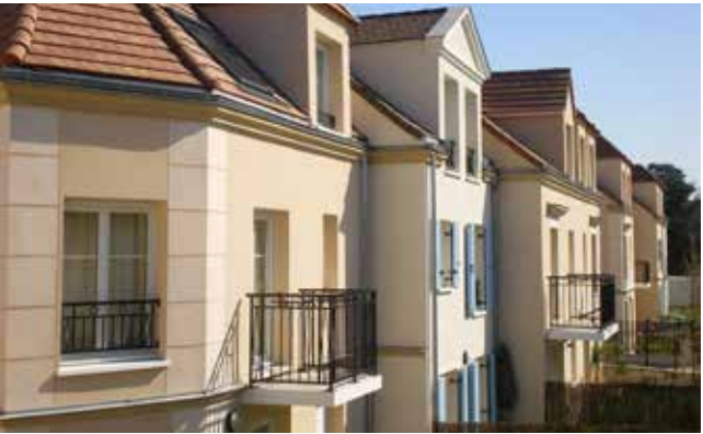
Le Clos des Cormiers - Chatou Architecte : Lanctuit Architectes