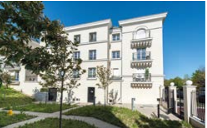
Le VI - Rueil-Malmaison