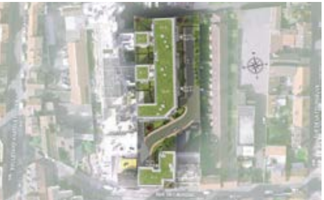
Palais Colbert - Le Plessis Robinson

Depuis plus de 45 ans, la société Les Nouveaux Constructeurs est un acteur important de la promotion immobilière en France ainsi qu'en Allemagne et en Espagne. Forte de cette expérience, la société a conçu et livré plus de 80 000 maisons et appartements de qualité.