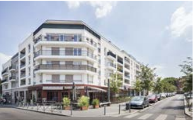
Carré Renaissance II - Noisy-le-Grand