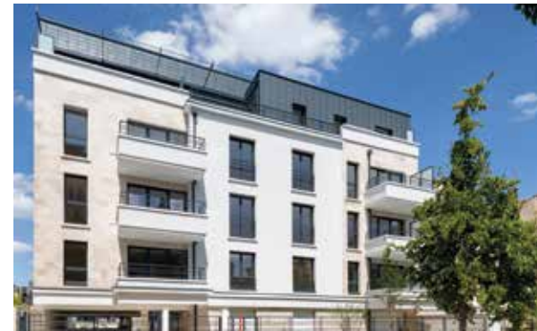
Villa Flora - Fontenay-sous-Bois Architecte : A2D Architecture