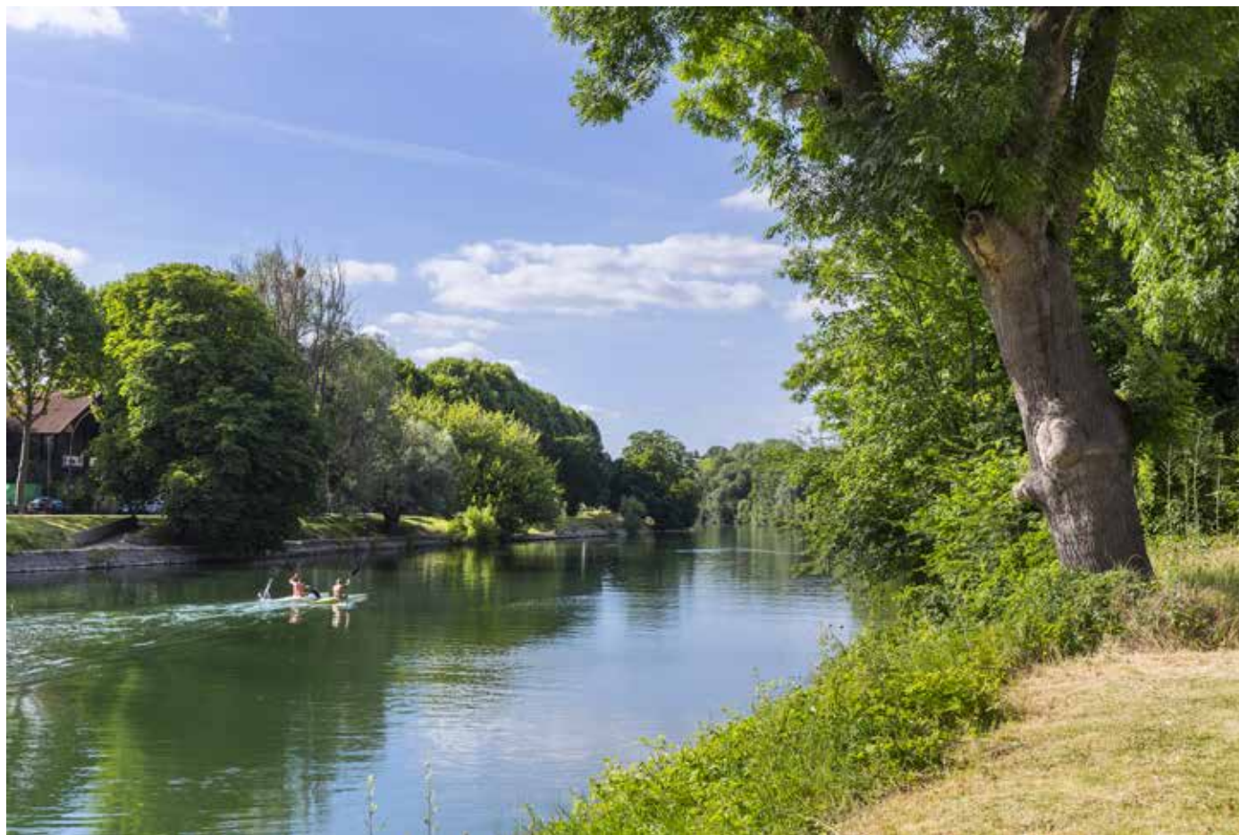
Chennevières-sur-Marne, une ville agréable et verdoyante située en bord de Marne