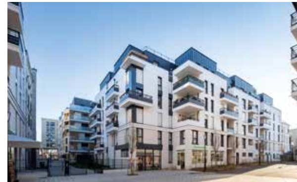
26 rue de Paris - Joinville-le-Pont Architecte : Smaïn Barkat