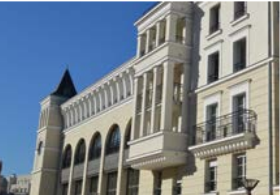
Grand Place - Chaville Architecte : Marc Breitman et Nada Breitman