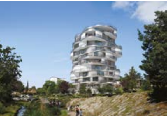
Folie Divine - Montpellier Architecte : Farshid Moussavi