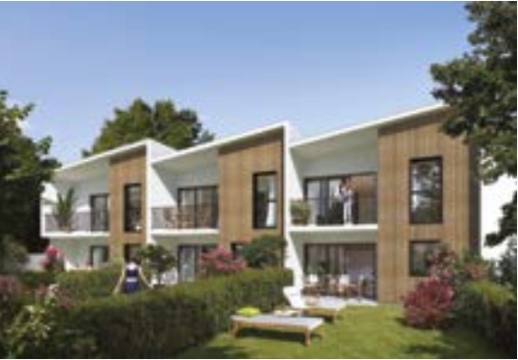
Villa Caudéran - Bordeaux Architecte : Alonso-Sarraute