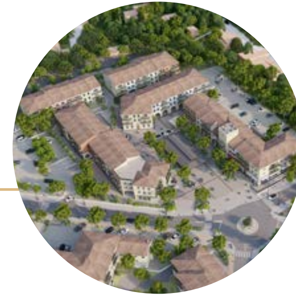
3 Le Verger