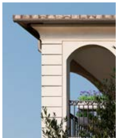
Pierre en chaînages d'angle

À l'image du campanile, rendant hommage aux anciens clochers méridionaux, les balcons ouvragés de Cœur Village reprennent également les codes de l'architecture régionale. La sobriété classique des grilles du début du XVIII e siècle a fait place au fil du temps à la fantaisie des motifs ornementaux (style rocaille, feuillages, éléments géométriques...).