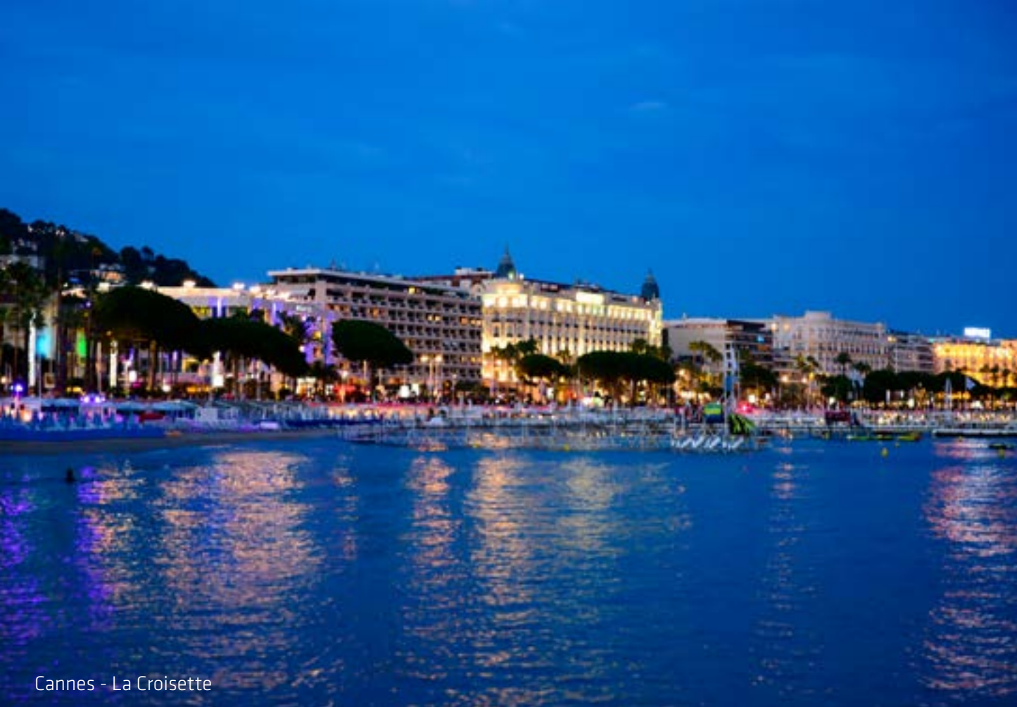
Cannes - La Croisette