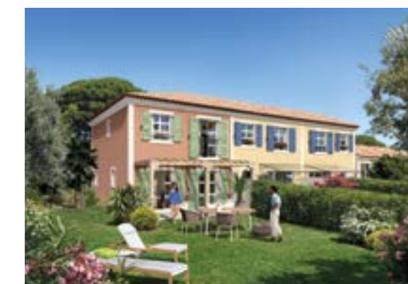
L'Orée des Pins à Roquefort-les-Pins