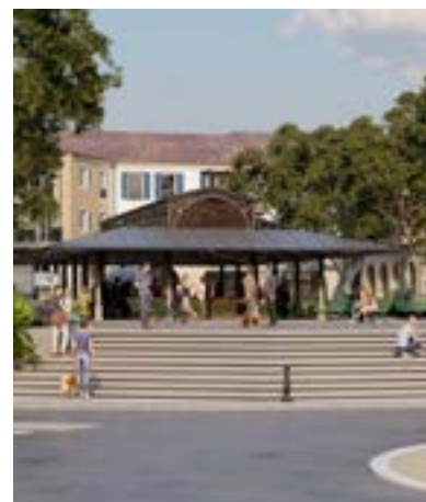
Halle de marché avec structure métallique

comme la pierre, le bois ... Des espaces publics agréables marqués par les mobilités douces et l'omniprésence du végétal... Rien de tel que du vrai pour faire du vrai ! Ce projet offre à la commune un nouveau centre de vie révélant une vraie qualité d'usages et dégageant un sentiment d'intemporalité, de sérénité.