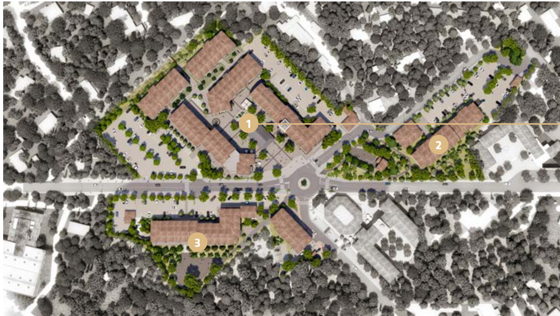
1 La Place du Village