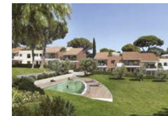
Les Jardins de la Valmasque à Mougins