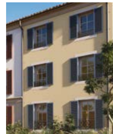
Volets battants à la « niçoise »

Il y a des millions d'années, le retrait de la mer a donné naissance à des sables ocreux et à des panoramas spectaculaires de roches déclinant toutes les couleurs du soleil. Les pigments naturels sont utilisés depuis la préhistoire, comme en témoignent pour exemple les peintures rupestres.