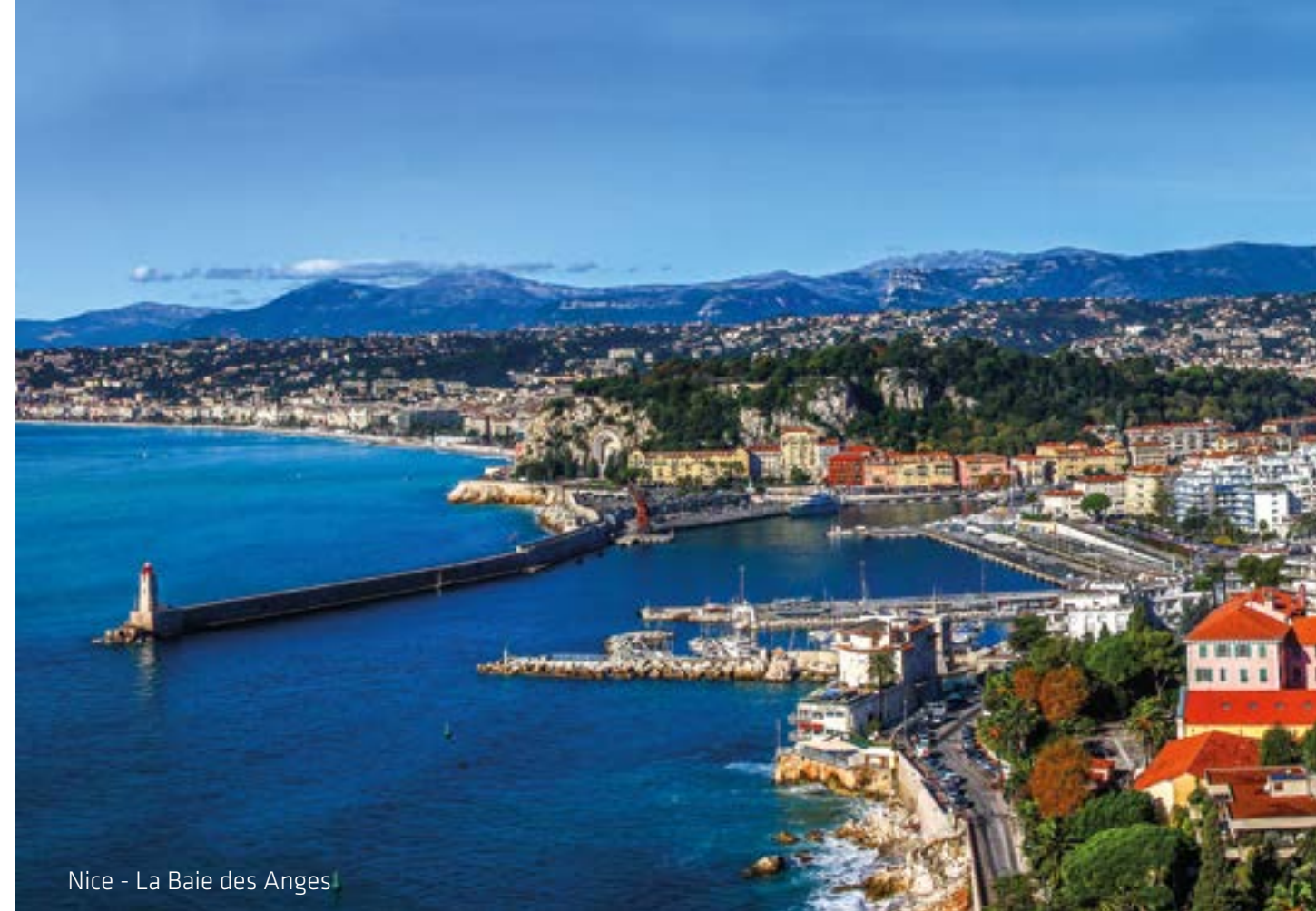
Nice - La Baie des Anges