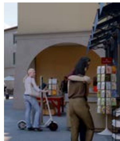
Arcades en séquences

La pierre a été utilisée de tout temps pour façonner et fortifier les encoignures des constructions à la jonction de 2 murs. Réalisés en pierre ou en parement de pierre, ces éléments fonctionnels ajoutent aujourd'hui encore aux qualités esthétiques d'une réalisation.