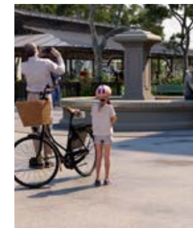
Place du village

Les toitures flamboyantes en tuiles de terre cuite font partie du paysage architectural méridional depuis des siècles. D'abord importées par les Grecs, en provenance d'Orient, elles ont ensuite été reprises par les Romains. Dès le XVII e siècle, les génoises ont été amenées par les maçons de Gênes en Provence, avant de s'étendre à tout le sud de la France.