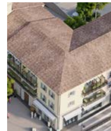
Toitures en tuiles de coloris panachés

Jusqu'au XVIII e siècle, avant la généralisation des vitrages, des panneaux en bois protégeaient les ouvertures des habitations des intrusions, de la pluie et du vent. Typiques de la région, les volets à la « niçoise » sont idéalement adaptés au climat : ils préservent du rayonnement solaire direct, tout en favorisant une ventilation naturelle et un apport de lumière en intérieur.