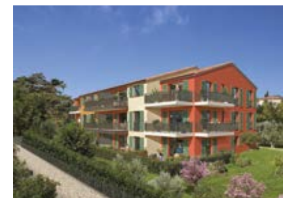
Esprit Village à Valbonne