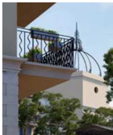
Balcons et éléments de serrurerie

Depuis toujours, la halle est un des principaux édifices publics organisant l'espace social de la cité. Anciennement en bois, nombre d'entre elles ont profité, à compter du XIX e siècle, de l'architecture du fer, accompagnant l'avènement de la civilisation industrielle, des progrès techniques et des ingénieurs-constructeurs tels que Gustave Eiffel.