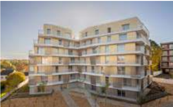
Domaine du Trianon - Noisy-le-Sec Architecte : Lambert Lenack Architectes Urbanistes