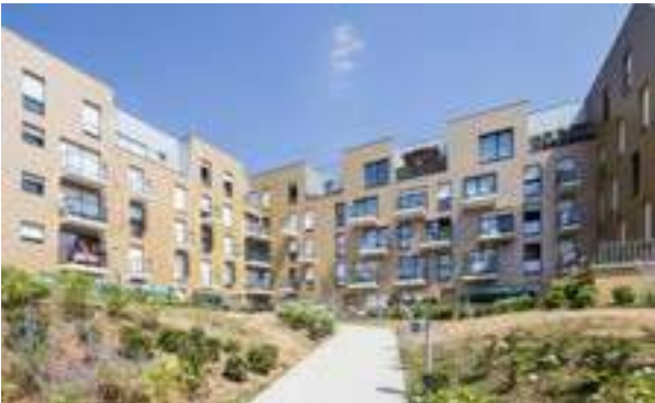
Jardin des Poètes - Pierrefitte-sur-Seine Architecte : Agence d'Architecture François Daune