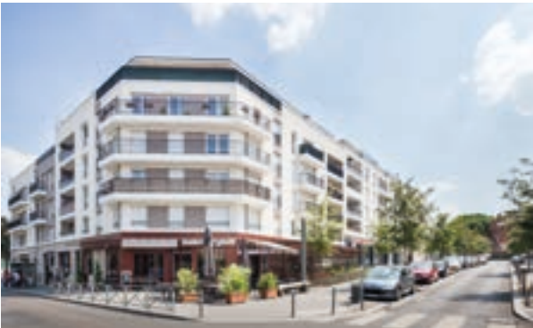
Carré Renaissance II - Noisy-le-Grand Architecte : Atelier au Bord de l'Eau - Architectonia