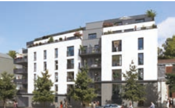
Nantes «Carré Zola» (44)