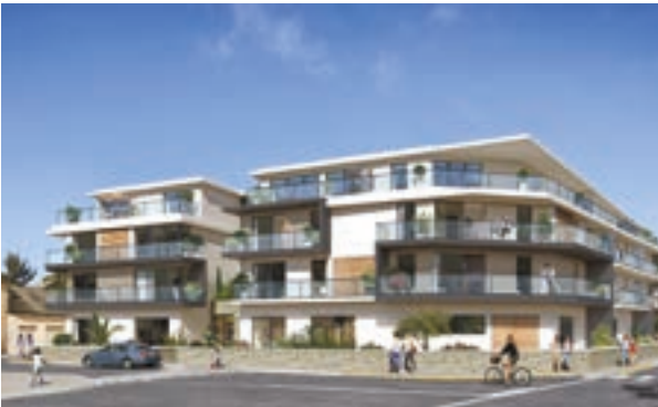
Pornichet «L'Estivale» (44)