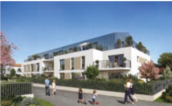
Saint-Sébastien-sur-Loire «Le Clos Cambronne» (44)