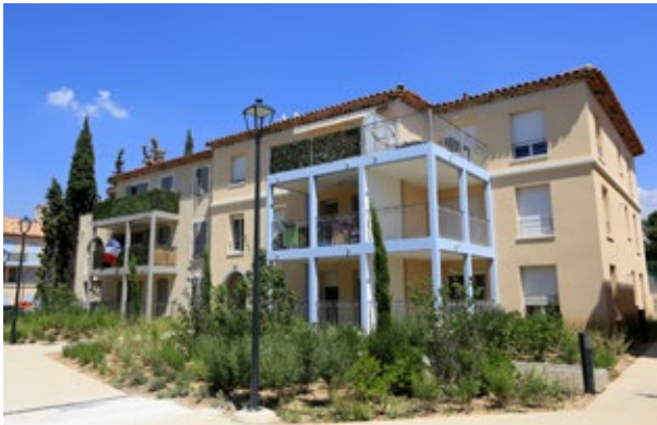
Le Domaine des Cyprès Allauch