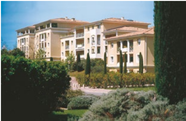
Parc de l'Amadour Aix-en-Provence