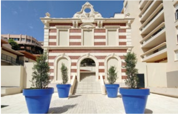
154 rue Breteuil Marseille 6 e