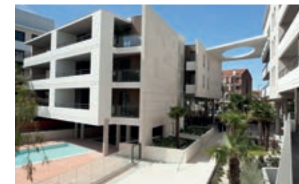
28, MONTFLEURY - CANNES Architecte : Jean-Philippe Cabane