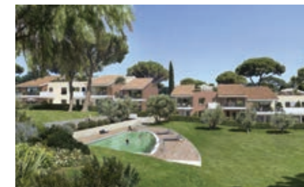
LES JARDINS DE LA VALMASQUE - MOUGINS Architecte : Jean-Philippe Cabane