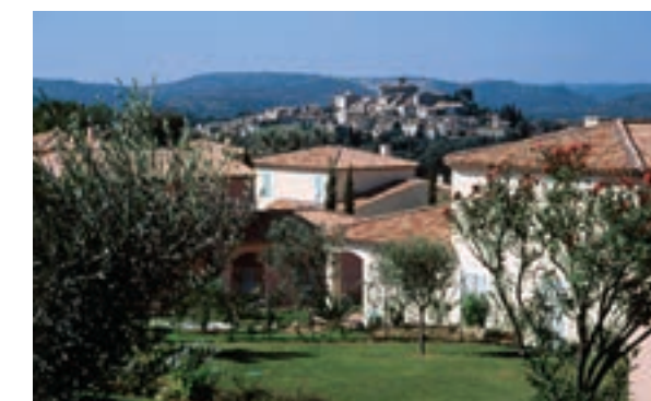
LE PARC DES IMPRESSIONNISTES - CAGNES-SUR-MER Architecte : Claude Dayet