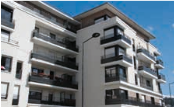
Villa Diderot - Saint-Denis Architecte : Hugues Jirou