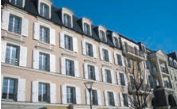
Carré Renaissance - Noisy-le-Grand Architecte : Cabinet Lionel de Segonzac et Cabinet Le Meur