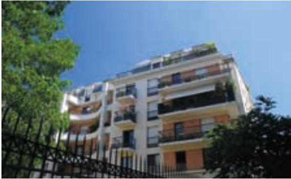
Les Jardins d'Atalante - Les Lilas Architecte : Eric Marmorat