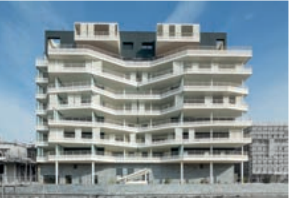
Pleinair - Montpellier

Architecte : Crochon Brullmann et Associés