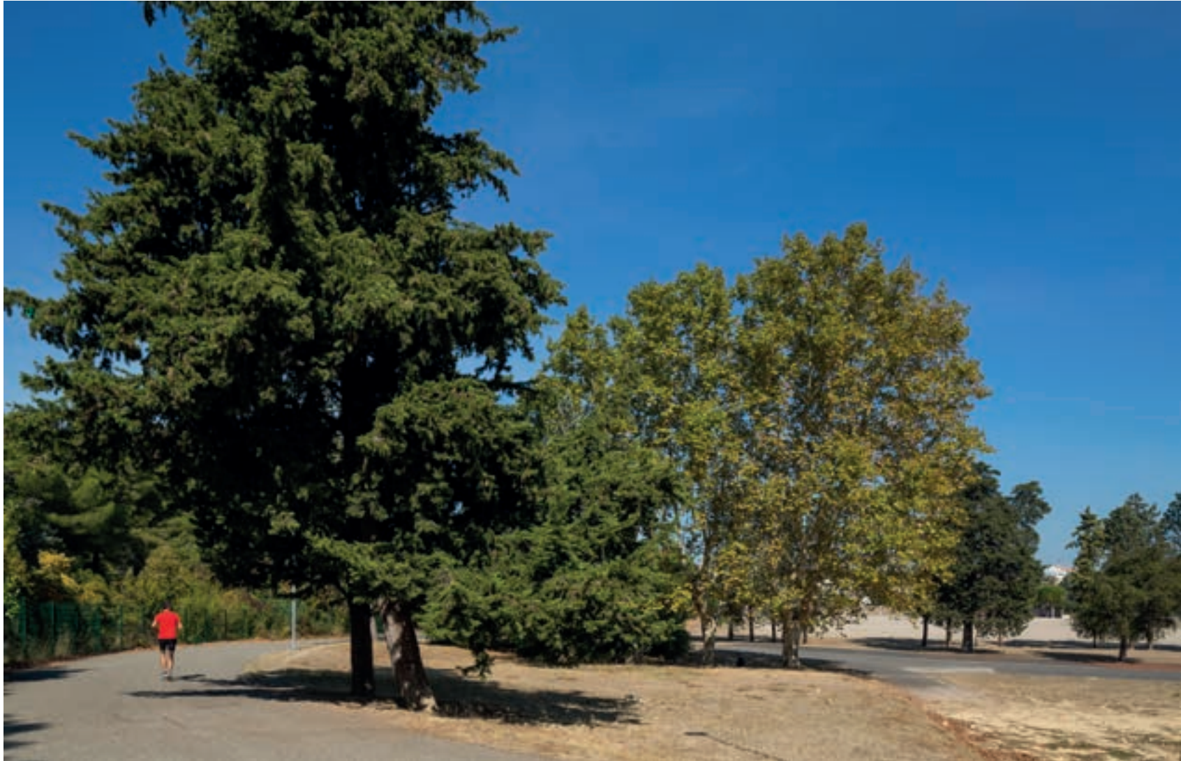
Un écrin de verdure au sein d'un quartier résidentiel préservé