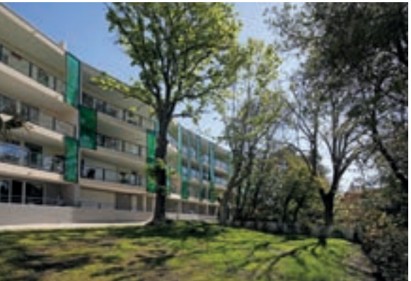
Les Matins d'Aiguelongue - Montpellier