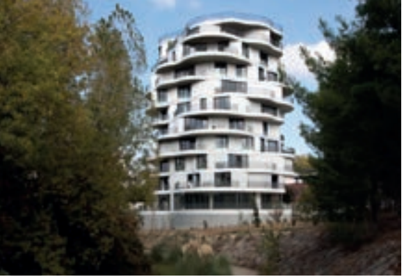
Folie Divine - Montpellier