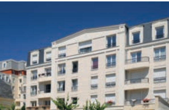
Les Chartreuses - Charenton-le-Pont Architecte : 3AM