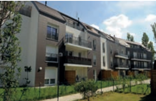
L'Orée du Bois - Limeil-Brévannes Architecte : Arc Arne