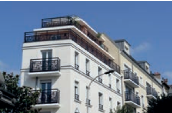
Côté Ville - Le Perreux Architecte : Lionel de Segonzac