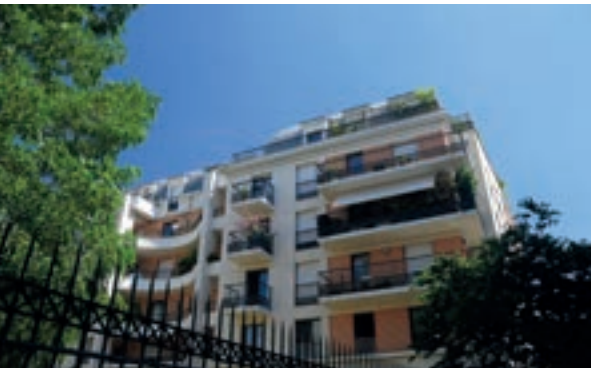
Les Jardins d'Atalante - Les Lilas Architecte : Eric Marmorat

Depuis plus de 40 ans , la société Les Nouveaux Constructeurs est un acteur important de la promotion immobilière en France ainsi qu'en Allemagne et en Espagne. Forte de cette expérience, la société a conçu et livré plus de 70 000 maisons et appartements de qualité. Depuis 2006, Les Nouveaux Constructeurs est cotée en bourse sur NYSE-Euronext Paris (compartiment B) et fait partie de l'indice SBF 250.