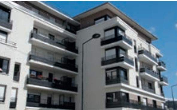
Villa Diderot - Saint-Denis Architecte : Hugues Jirou