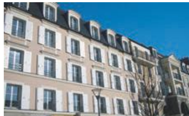
Carré Renaissance - Noisy-le-Grand Architecte : Cabinet Lionel de Segonzac et Cabinet Le Meur