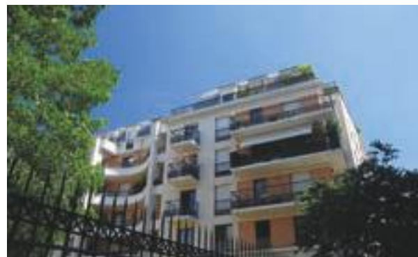
Les Jardins d'Atalante - Les Lilas Architecte : Eric Marmorat