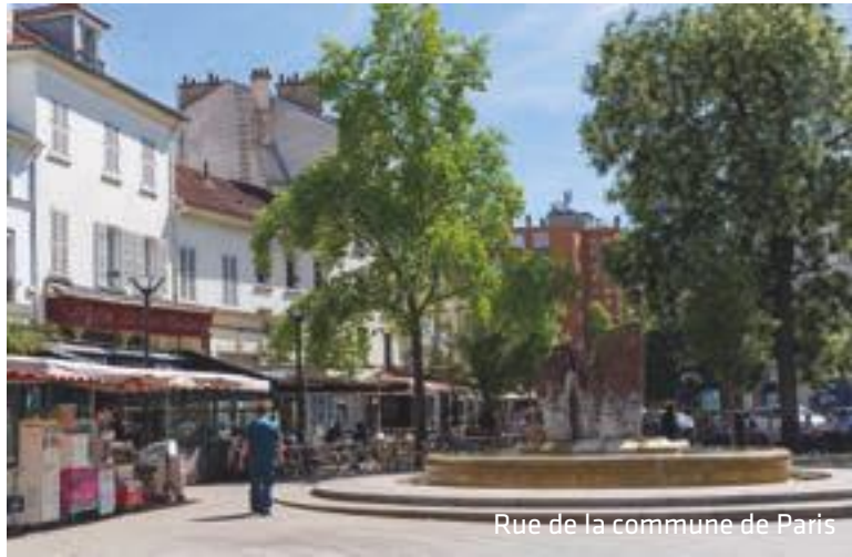
Rue de la commune de Paris