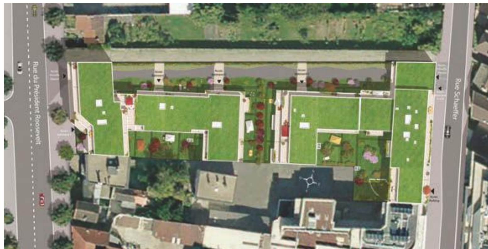
Côté Rue Roosevelt ►

Dessinée par l'agence Architectonia, la résidence 62 Roosevelt , composée de 2 bâtiments s'étend de l'avenue du Président Roosevelt à la rue Schaeffer. Vous accédez au cœur de la propriété par deux grands porches privatifs menant aux différents halls d'entrée. Cette venelle piétonne, en retrait de l'animation de la rue offre aux résidents différents aménagements paysagers. Arboré de différentes essences, ce poumon aux tonalités changeantes au fil des saisons offre un cadre de vie emprunt de sérénité et de quiétude. Pour vous garantir confort et praticité au quotidien, le parking disparaît en sous-sol.