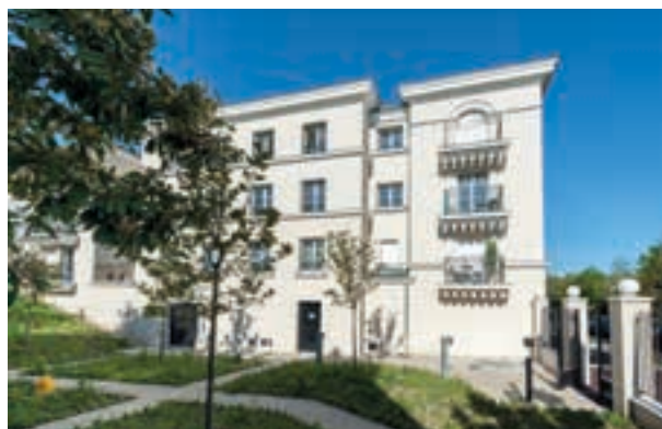
Le VI - Rueil-Malmaison