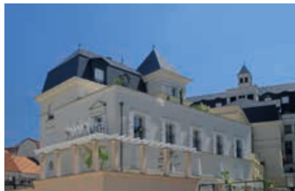
Palais Colbert - Le Plessis Robinson