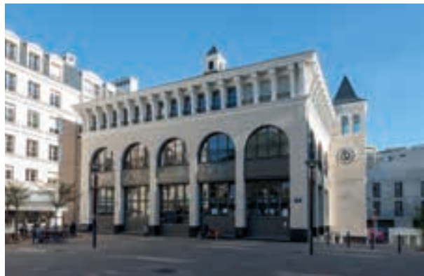
Grand Place - Chaville