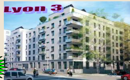
"Le 48" Abondance