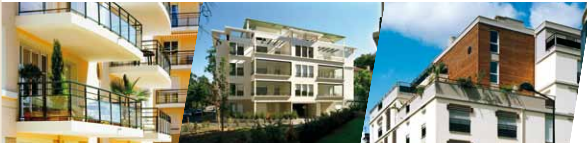
Les Allées Bagatelle - Lyon 8 e

Concevons votre espace de vie Créateur d'espaces de vie depuis 40 ans