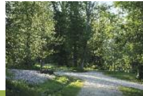
Parc de Noisiel