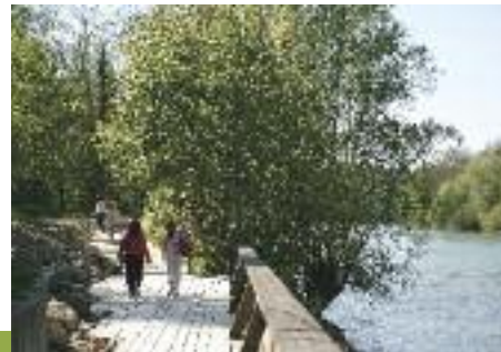
Bords de Marne