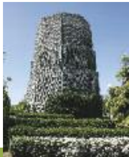
Rond-point des 4 pavés