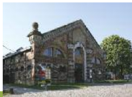
Ferme du Buisson