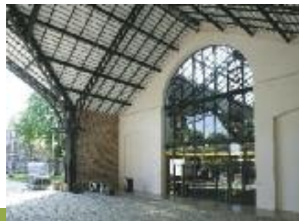
Médiathèque Ferme du Buisson