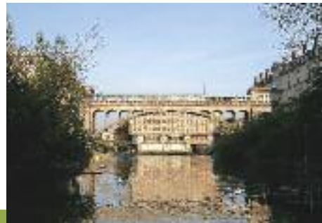
Ancienne chocolaterie Menier